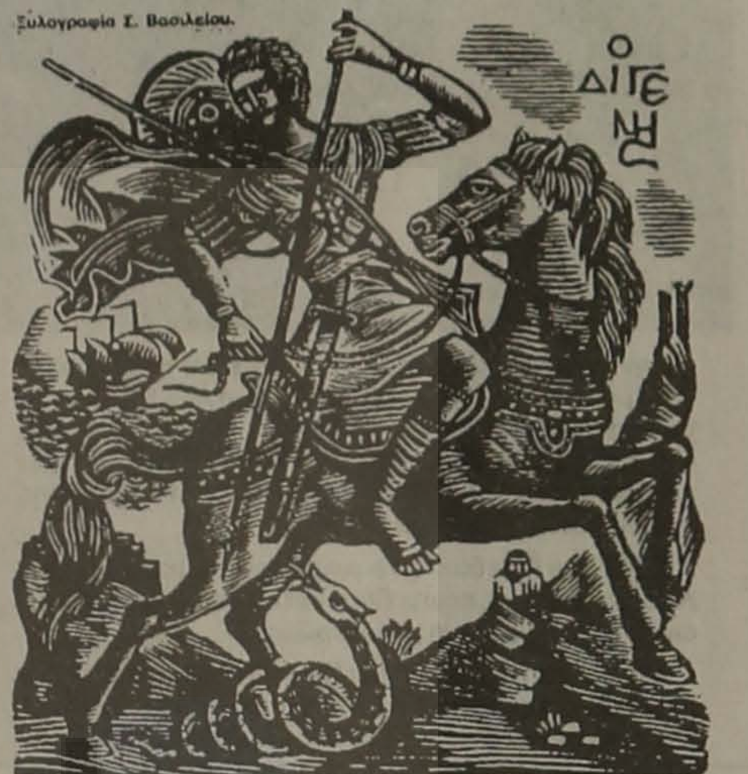
Ο Διγενής. Ξυλογραφία Σ. Βασιλείου.

γίσματα σ' εφτάνω κοντοφτάνω (αρ. 14) Κ. Ρωμαίου. Η ποίηση ενός λαού σελ. 29.