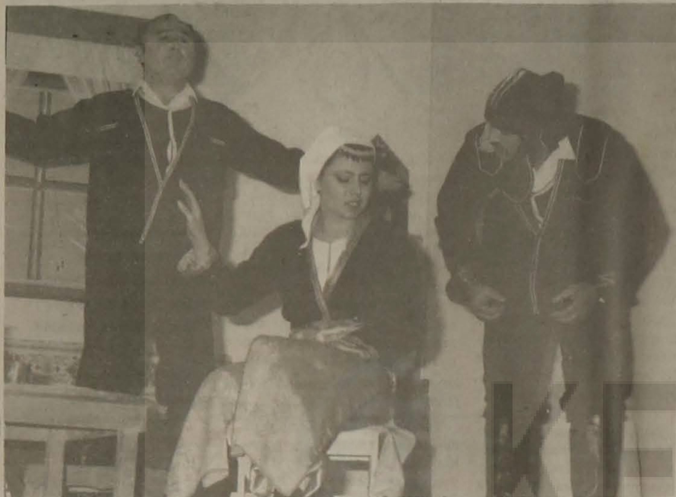
Στιγμιότυπο από την παράσταση

Μεγάλη επιτυχία σημείωσε το ανέβασμα του ποντιακού έργου "Ο Ξενητέας" του Φίλιωνα Κτενίδη από τον ερασιτεχνικό θίασο της Ευξεινού Λέσχης Βέροιας. Συγκεκριμένα στη Βέροια δόθηκαν δύο παραστάσεις και μία στην Αλεξάνδρεια. Ανάλογη επιτυχία αναμένεται και στη Νάουσα στις 4/5/89.