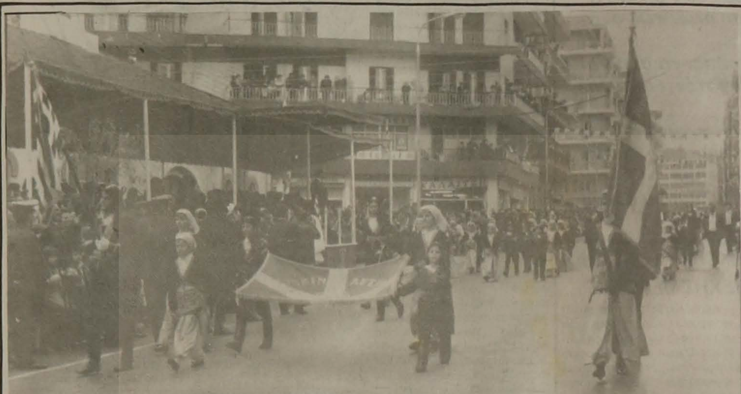
Στιγμιότυπο από την παρέλαση της 25ης Μαρτίου