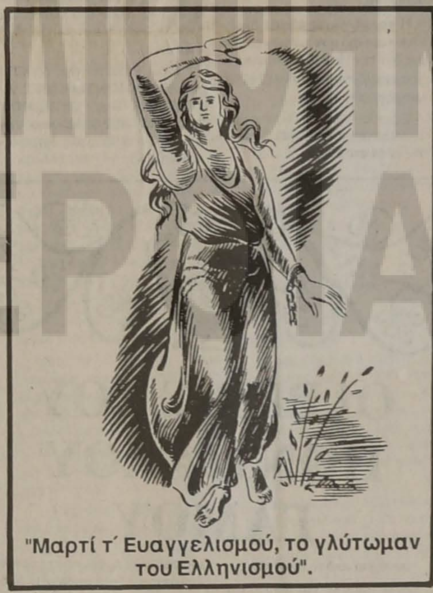
"Μαρτί τ' Ευαγγελισμού, το γλύτψωμ του Ελληνισμού".