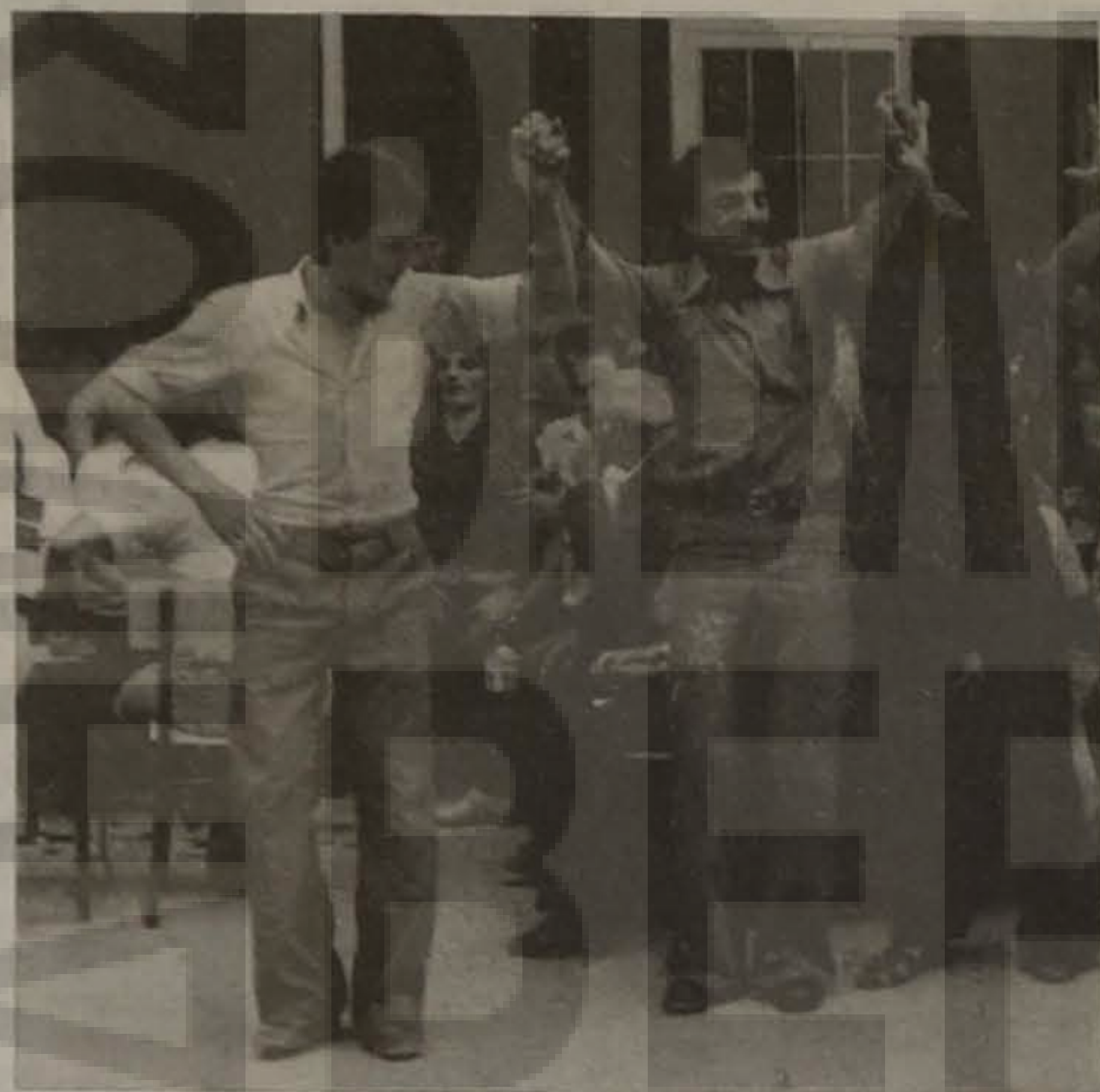
Πρόσφατη φωτογραφία από τον Πόντο