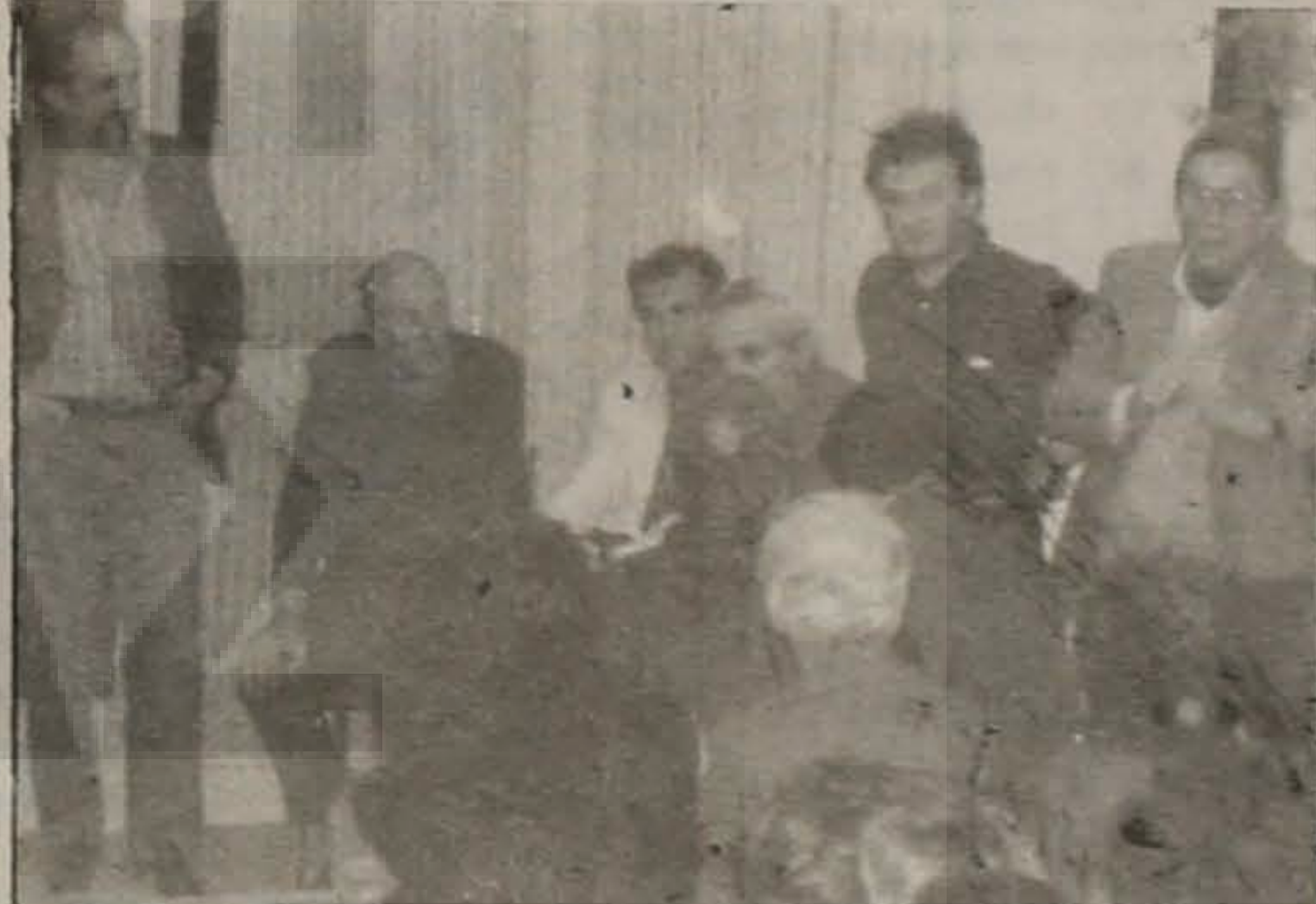
- Ο κ. Καμπανέλης, ενώ συνομιλεί.

Την Δευτέρα 13 Νοεμβρίου, ώρα 8.30 μ.μ., επισκέφθηκε τα Γραφεία της Ευξείνου Λέσχης Βέροιας ο σκηνοθέτης Ιάκωβος Καμπανέλης. Ο κ. Καμπανέλης συνομιλήσε με τα μέλη της χορωδίας. Η παρουσία του ενθουσίασε και άφησε ευχάριστες εντυπώσεις.