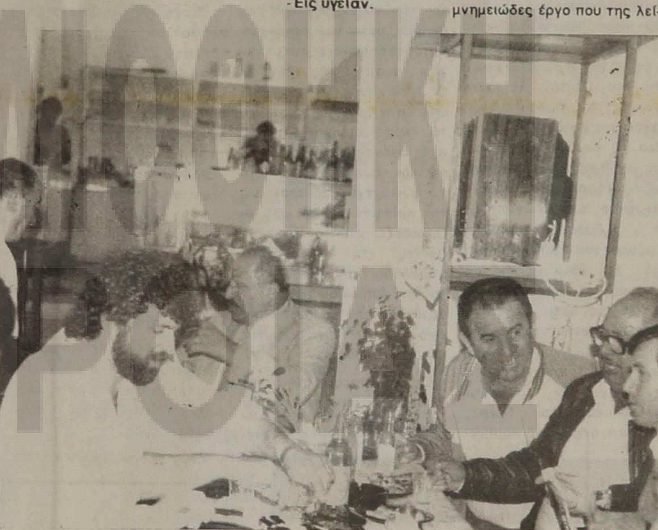
- Σε κάποιες ώρες...

Απάντηση: Για να λέμε την αλήθεια, ρεαλιστικά και χωρίς νάμαστε ονειροπόλοι, σήμερα ο πολιτισμός και γενικά ότι έχει σχέση με αυτόν περνάει τεράστια κρίση και ιδιαίτερα στην Ελλάδα. Αλλά πράγματα