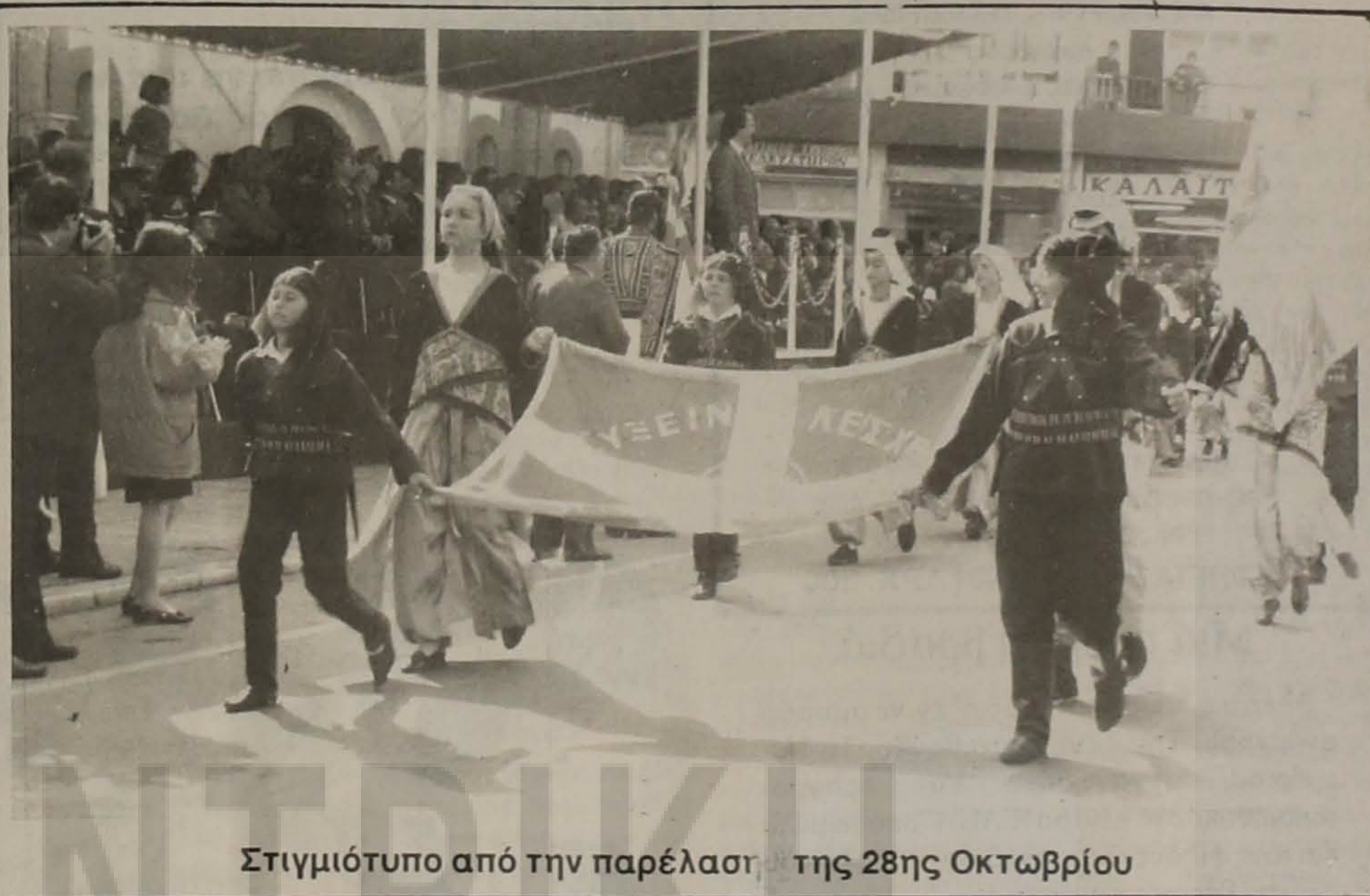
Στιγμιότυπο από την παρέλασιν της 28ης Οκτωβρίου

Ως Επίσκοπος της Εκκλησίας και Μητροπολίτης της Το-