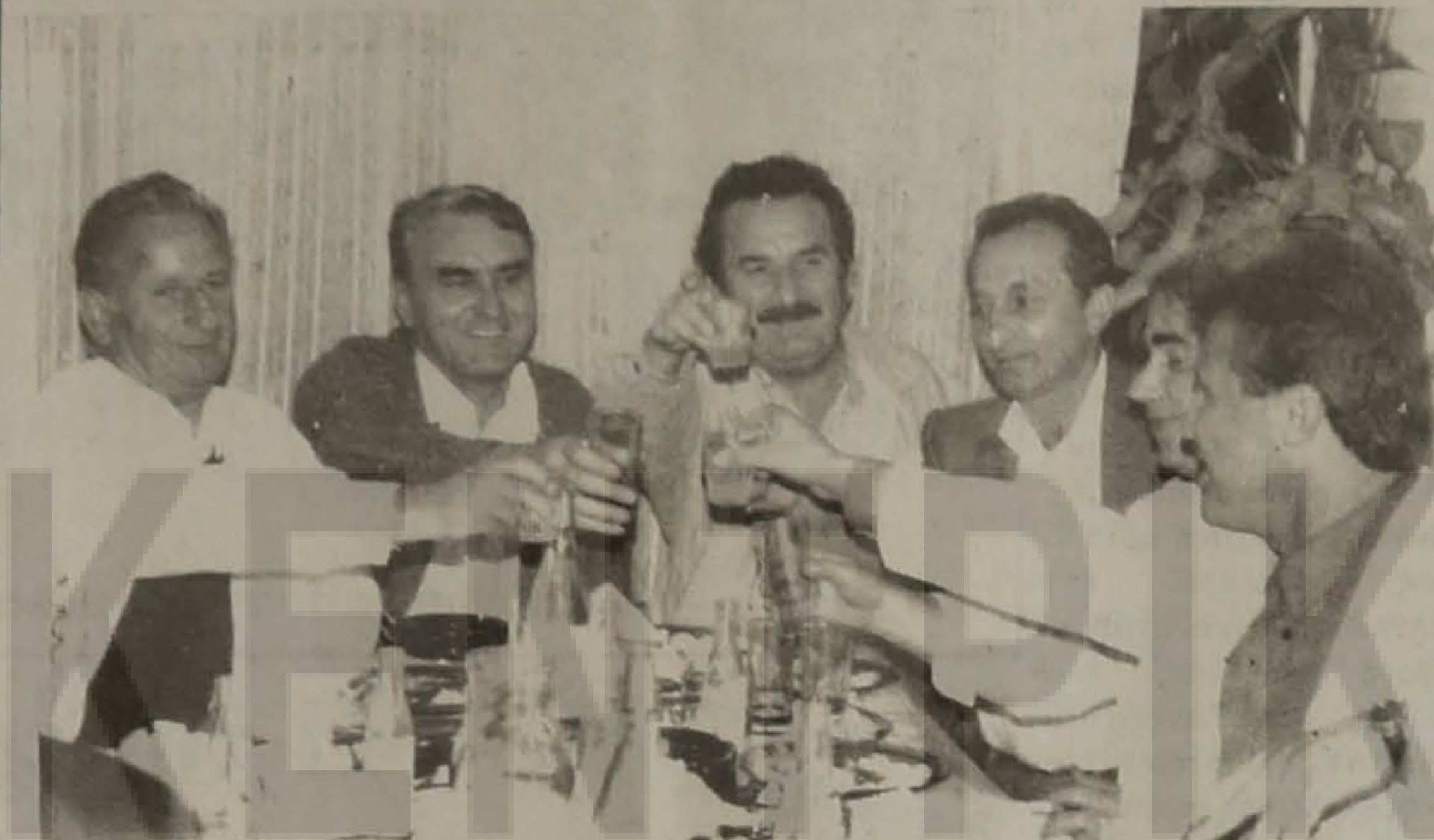
- Είς υγιάν.

- Καμιά εργασία δημοσιευμένη ή όχι δεν επιστρέφεται.