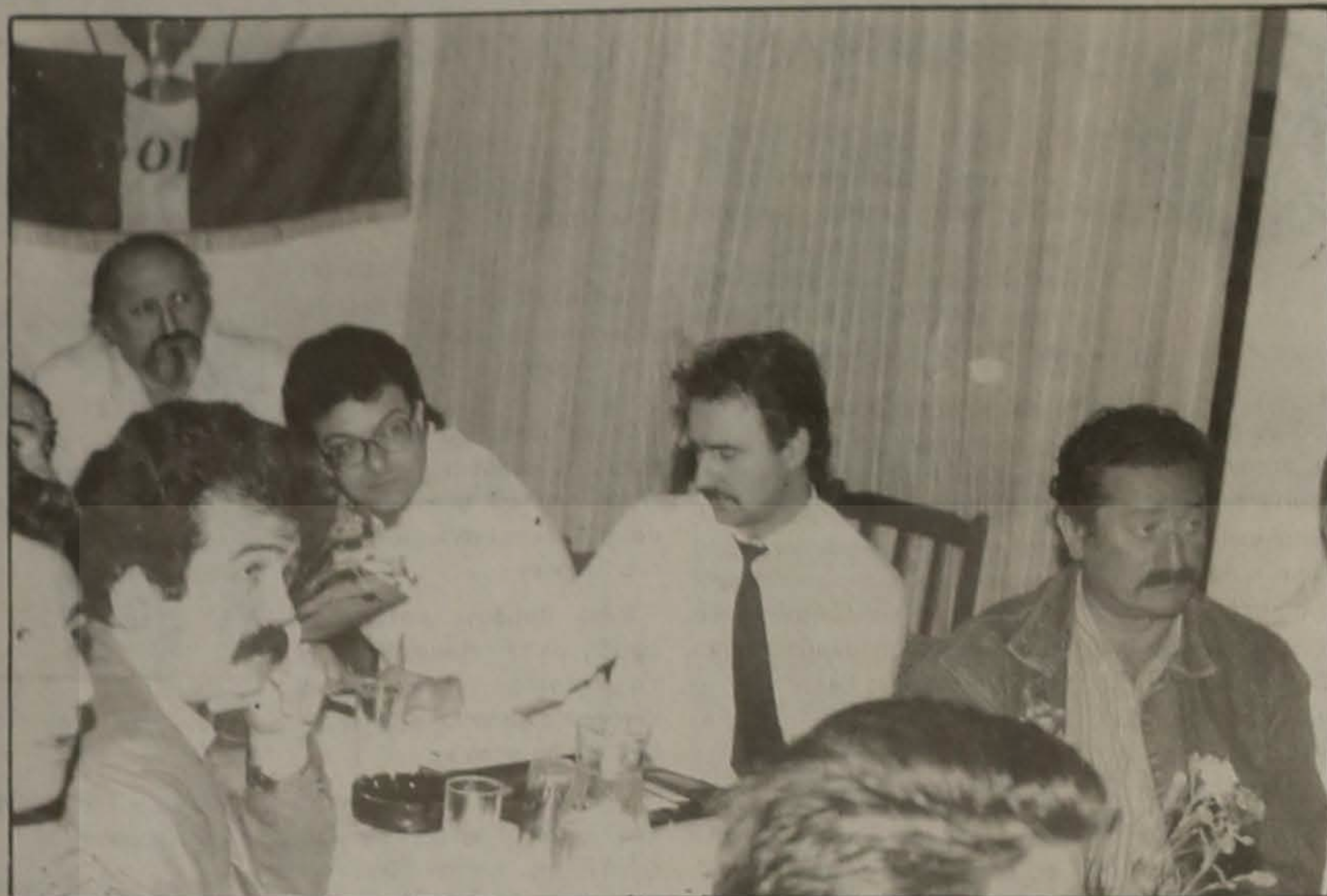
Στιγμιότυπο από τη συνάντηση με τον τοπικό τύπο.

Συνέντευξη τύπου για την πορεία των εργασιών της ανέγερσης του Πνευματικού Κέντρου έδωσε το Διοικητικό Συμβούλιο της Ευξεινού Λέσχης Βέροιας στις 3/10.