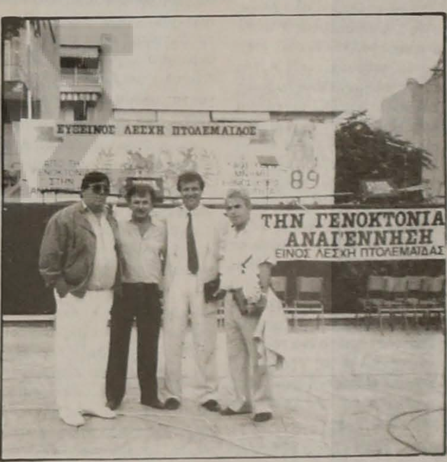
Αναμνηστική φωτογραφία από την Πτολεμαίδα, όπου η χορωδία της Ευξείνου Λέσχης Βέροιας στις 10/9/89 έδωσε επιτυχημένη συναυλία στα πλαίσια των τοπικών καλλιτεχνικών εκδηλώσεων.