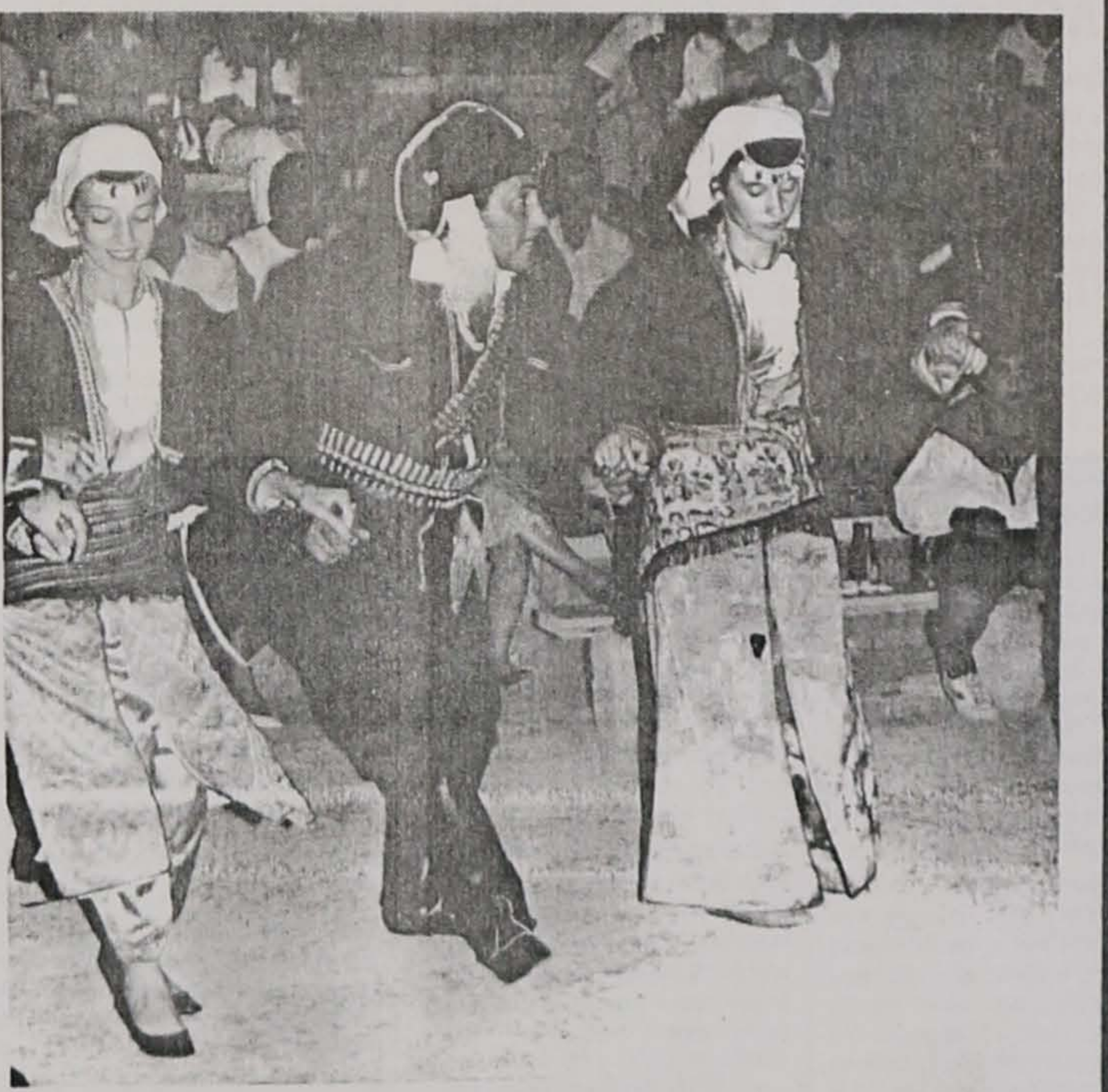
Η παράδοση συνεχίζεται