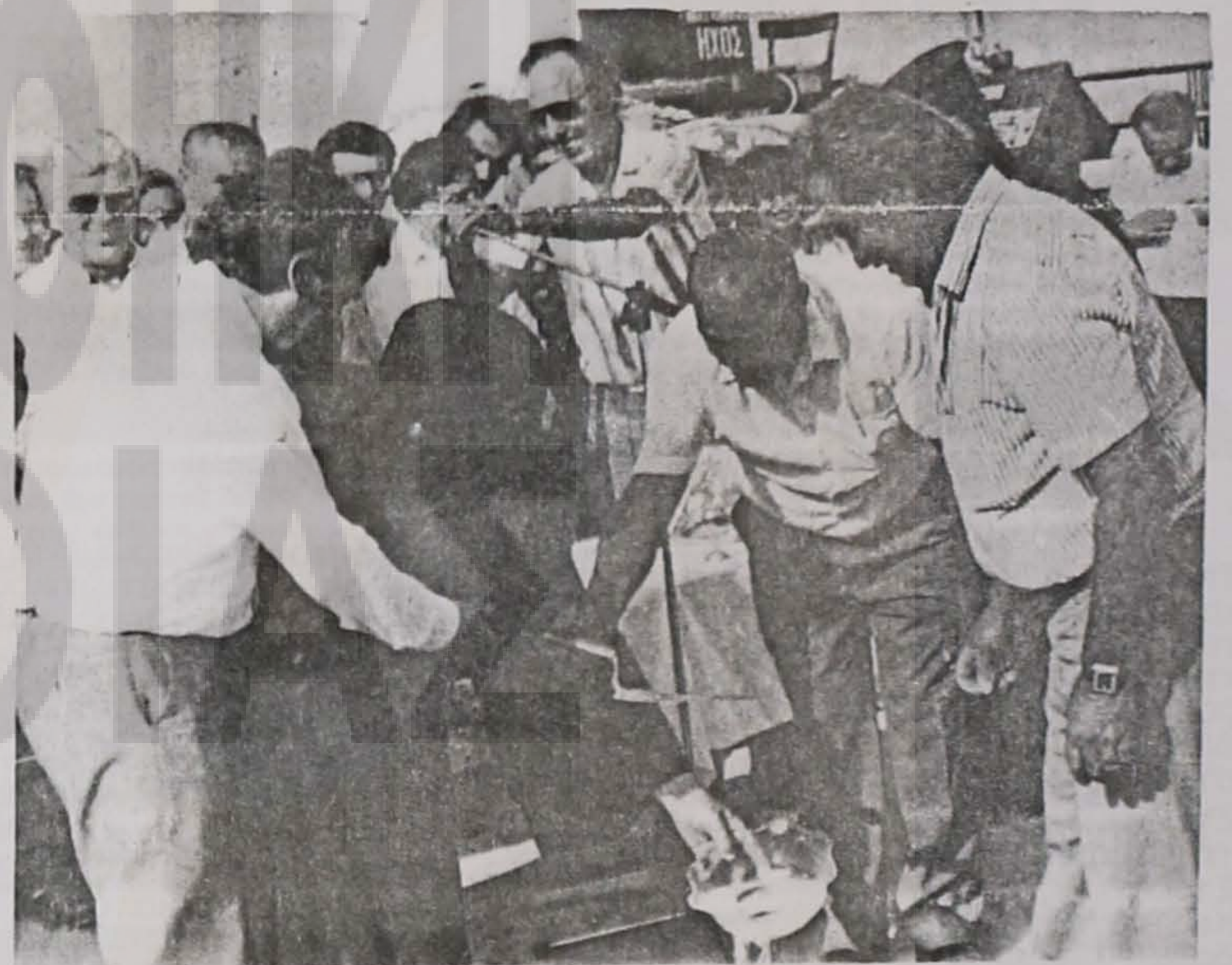
- Στιγμιότυπο από την τελετή του αγιασμού.

Θεμελιώνουμε το Πνευματικό Κέντρο με τις προσδοκίες και την ελπίδα να αποτελέσει μιά κυψέλη. Με το έργο αυτό τιμού