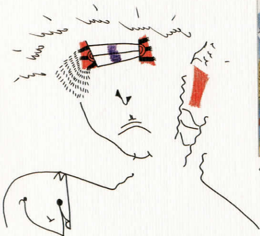
Χωρίς τίτλο, μελάνι σε χαρτί, 30 X 40 εκ., 2003