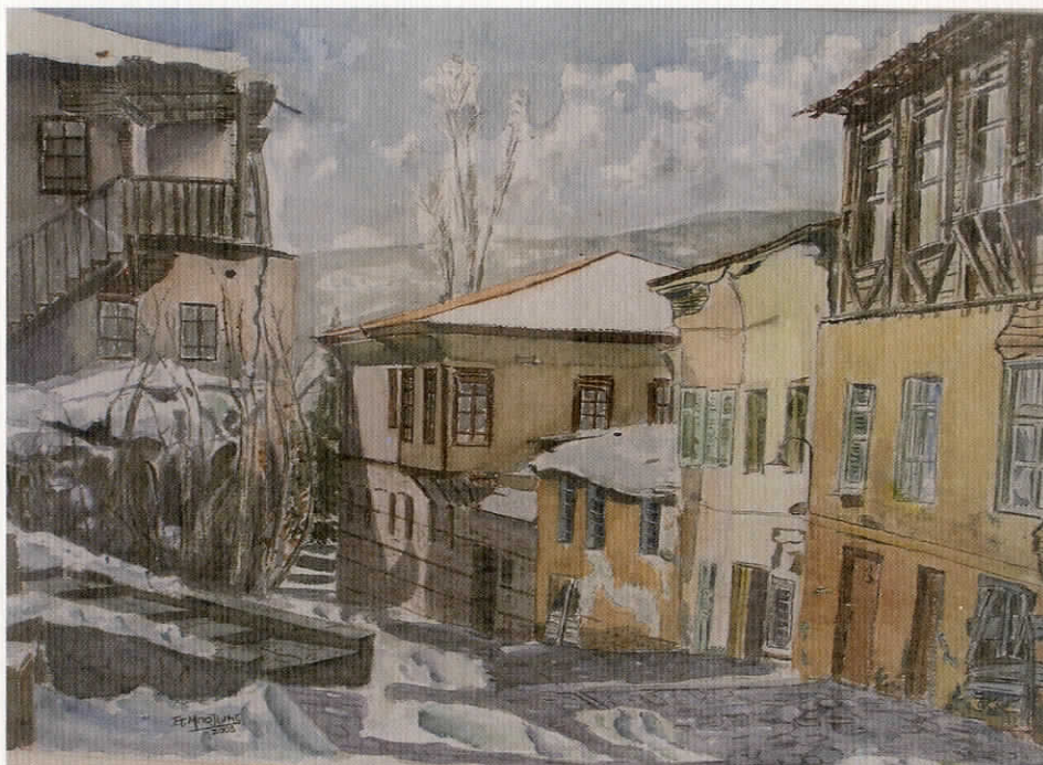
«Εβραϊκή συνοικία», υδατογραφία, 50 X 70 εκ., 2003

Με τη ζωγραφική ασχολείται από μικρός με έμφυτο ταλέντο. Έχει παρακολουθήσει μαθήματα ελεύθερου και γραμμικού σχεδίου και ασχολήθηκε με την παραγωγή αφισών και μακέτας. Τα τελευταία χρόνια ασχολείται με τη δημιουργική υδατογραφία και τα παστέλ. Τα έργα του είναι βιωματικά, αστικά τοπία, τοπιογραφίες και πορτραίτα, στιγμές της καθημερινότητας.