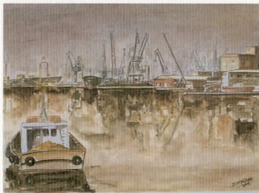
«Λιμάνι», υδατογραφία, 35 X 50 εκ., 2005