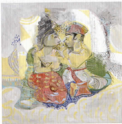
«Couples», ακρυλικό σε καμβά, 100 X 100 εκ., 2001

Είναι στο δεύτερο χρόνο της εκπόνησης διδακτορικής διατριβής στο Καποδιστριακό Πανεπιστήμιο Αθηνών με υποτροφία του ΙΚΥ στη διαπολιτισμική καλλιτεχνική εκπαίδευση.