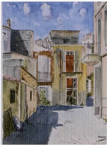
«Πλωμάρι», υδατογραφία, 35 X 50 εκ., 2004