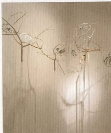
«Κατασκευασμένα δένδρα», ξύλο, PVC, 2006