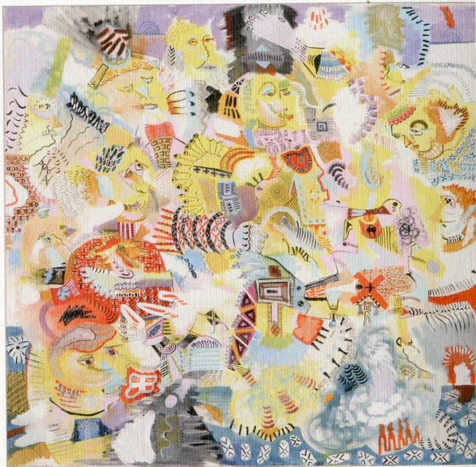
«Crowd», ακρυλικό σε καμβά, 100 X 100 εκ., 2002