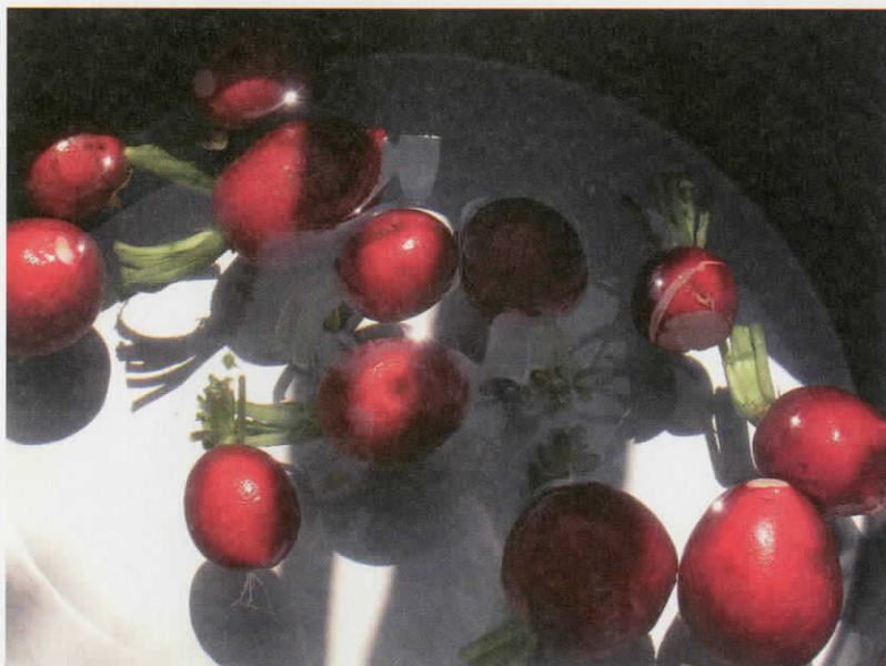
Κωνσταντίνος Κίσσας «Χωρίς τίτλο», 2006, 60 x 80 εκ. φωτογραφία τυπωμένη σε χαρτί ακουαρέλας