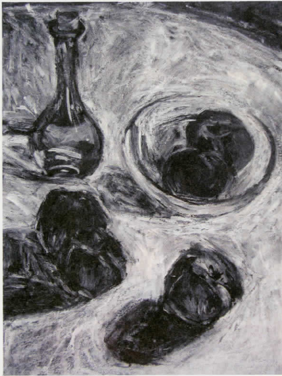
Θάνος Στάκας «Νεκρή φύση με καρφαράκι και ροδάκινα» 2010, 45 x 35 εκ., μαρκαδόροι λαδιού σε χαρτί