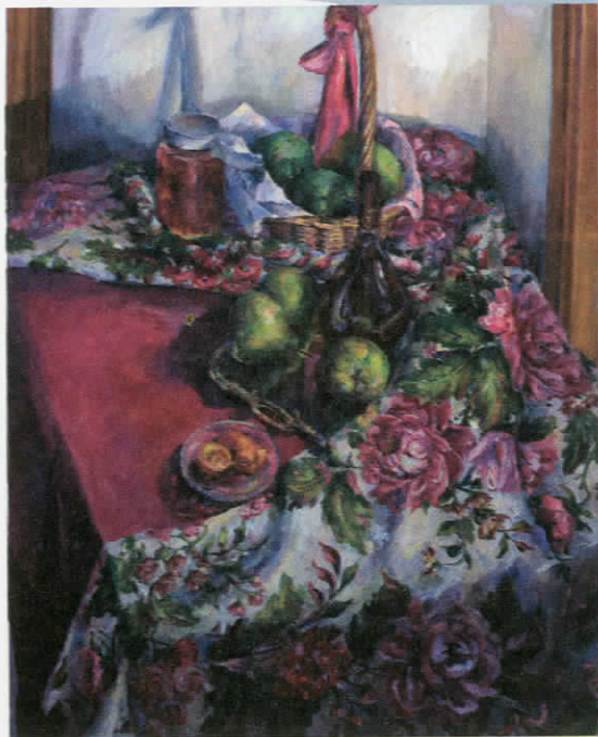
Μαρία Τζιροζίδου «Νεκρή φύση», 2010, 100 X 80 εκ., λάδι σε καμβά