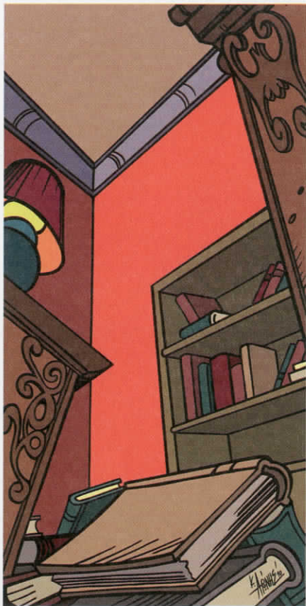
Κώστας Αρώνης «Ατυχές Επεισόδιο 1», 2010, 40 x 80 εκ., ακρυλικά σε καμβά