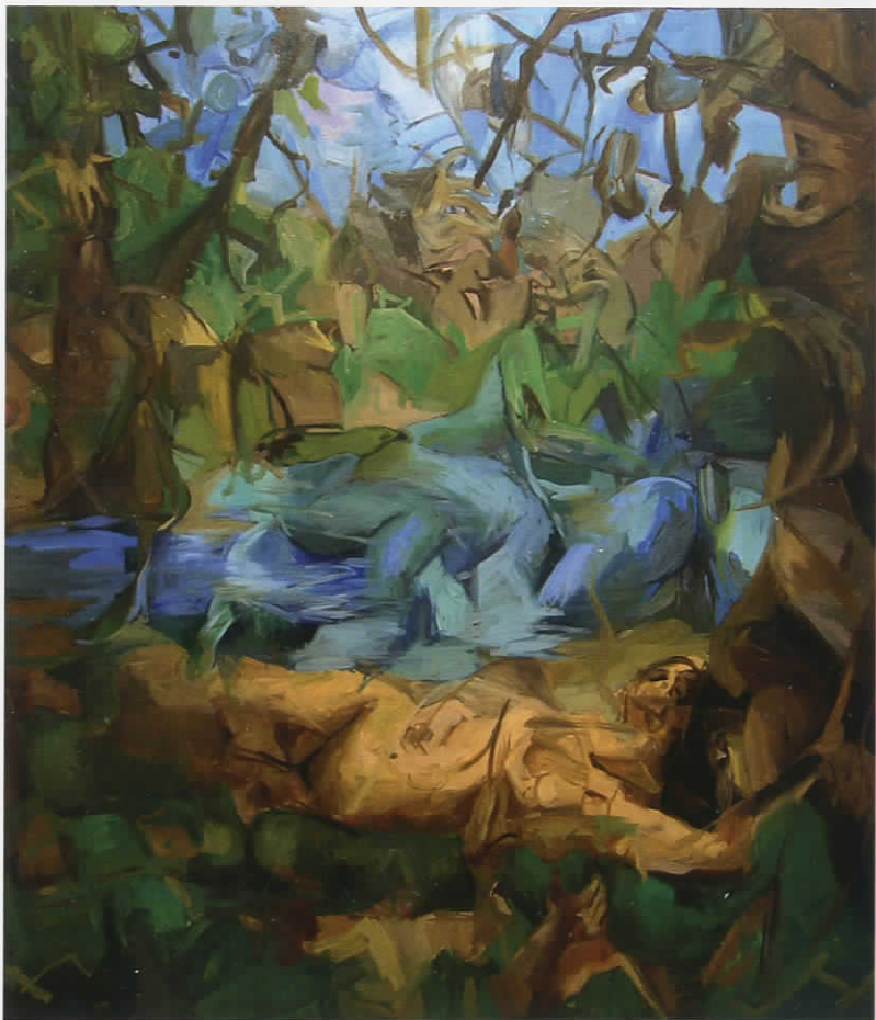
Χωρίς τίτλο, 2010, λάδι σε μουσαμά, 160X140 εκ.