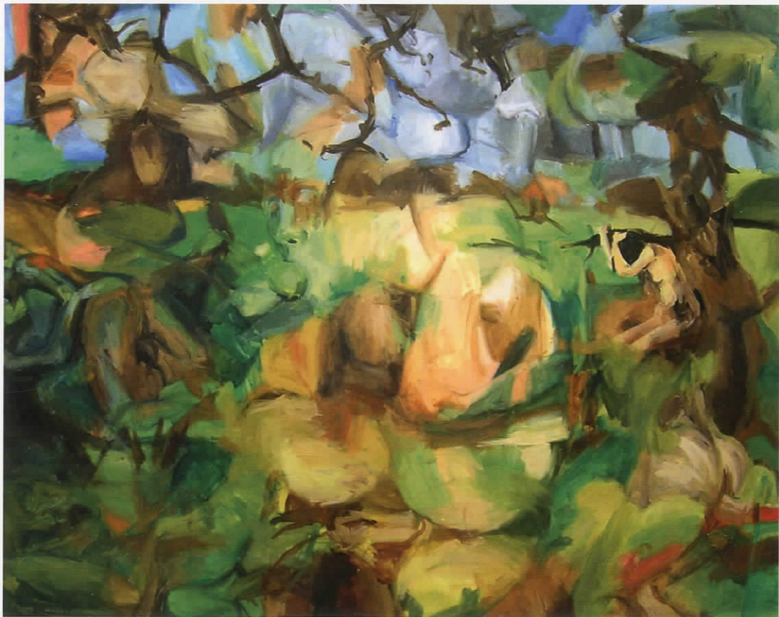
Χωρίς τίτλο, 2011, λάδι σε μουσαμά, 80X100 εκ.