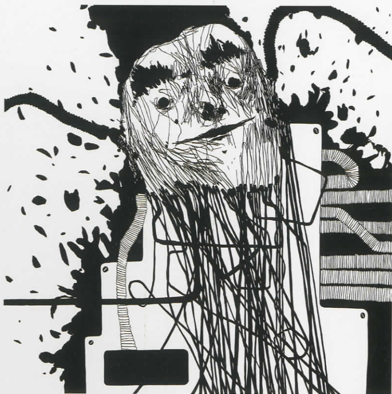
Πορτρέτο II, λινόλεουμ, 60x60cm, 2007