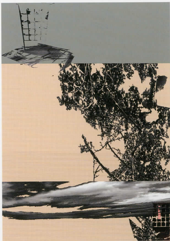
Untitled , ψηφιακή εκτύπωση I, 49x69cm, 2007