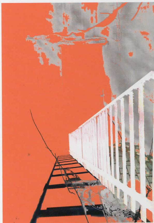
Untitled , ψηφιακή εκτύπωση II, 49x69cm, 2007