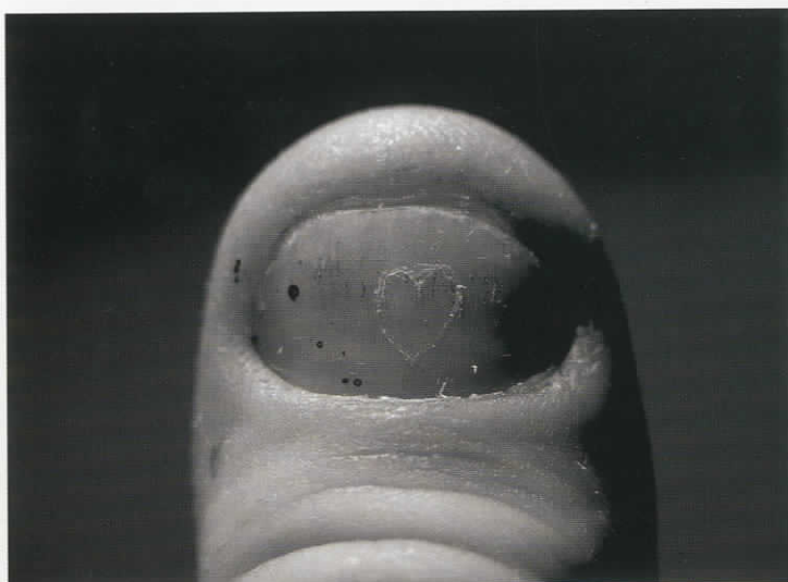
Χωρίς τίτλο, φωτοχαρακτική σε τσίγκο, 57x42cm, 2008