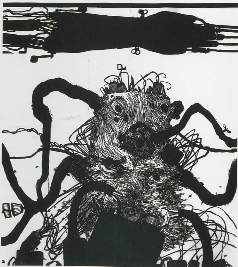
Πορτρέτο III, λινόλεουμ, 52x59cm, 2008