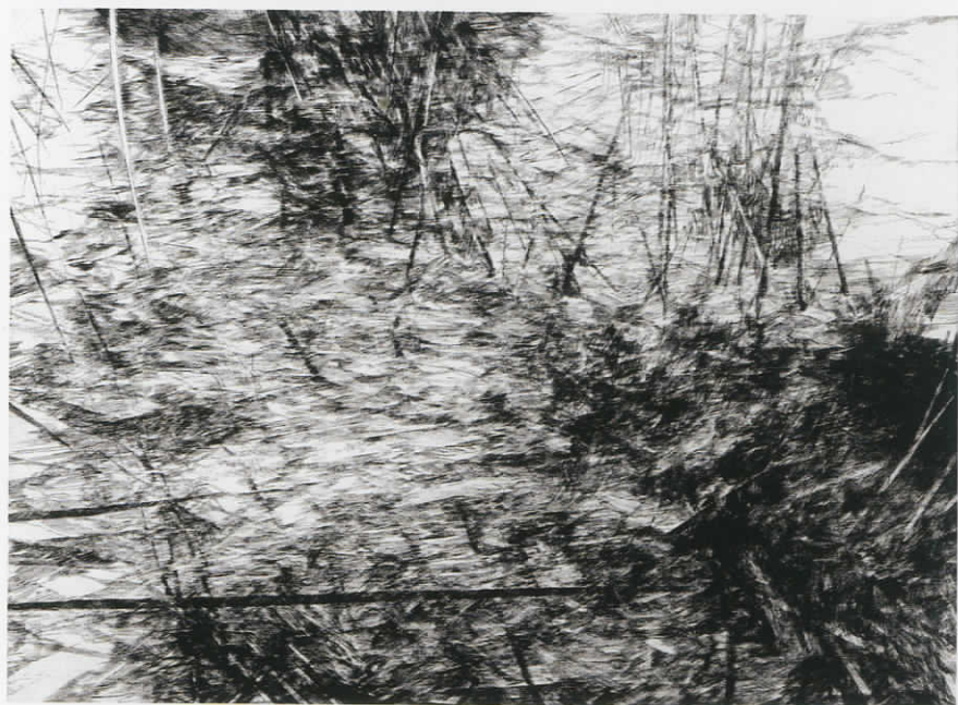
Letizia , Ξηρή χάραξη με μπιρέν σε πλάκα τσίγκου, 40x30cm, 2006