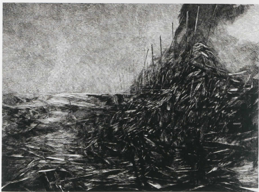
Mestizia II , οξυγραφία και Ξηρή χάραξη με μπιρέν σε πλάκα τσίγκου, 40x30cm, 2004-05