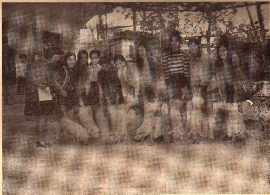
Ή ύπάλληλος Άγροτ. Οικ. Οικονομίας Γραφείου Ναούσης παραδίει χοιρίδια φυλής LANDRASSE εις Άγροτονεάνιδας Μ.Σ.Α.Ν. Κοπανού, διά την έκτροφήν ως έπιβλεπομένων έργων.