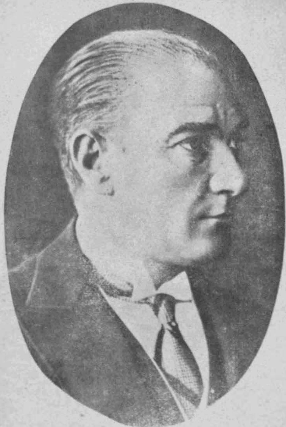
ΘΑΗΜΙΟΥΡΓΟΣ ΤΗΣ ΜΕΓΑΛΗΣ ΤΟΥΡΚΙΑΣ ΚΑΜΑΛ ΑΤΑΤΟΥΡΚ