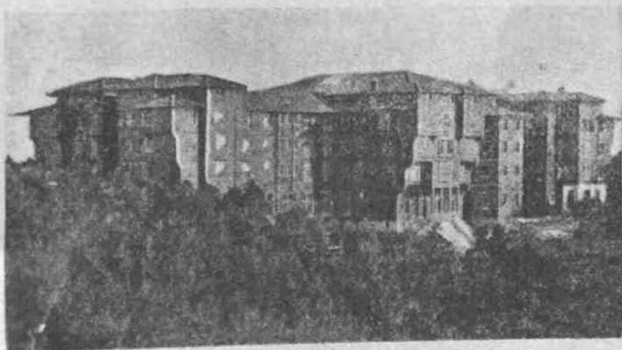
Ὁρφανοτροφεῖον ἁρρένων Πριγκήπου

Αἰωνία σου ἡ μνήμη ἀλησμόνητέ μας πατέρα. Αἰωνία σου ἡ μνήμη.