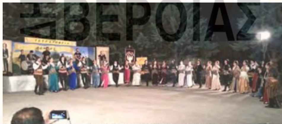
Στηγμάτιο από την παρουσίαση του χορευτικού της Ε.Λ.Β.

Τη δεύτερη μέρα των εκδηλώσεων το κοινό είχε τη δυνατότητα να παρακολουθήσει, μέσω μία σύντομης αναδρομής στο παρελθόν, το ιστορικό των τμημάτων του Συλλόγου από την ημέρα ίδρυσής του έως και σήμερα. Στη συνέχεια τη σκυτάλη έλαβαν τα χορευτικά του Ποντιακού Μορφωτικού Συλλόγου Αγ. Δημητρίου- Ρυακίου, του Συλλόγου Θρακιωτών και