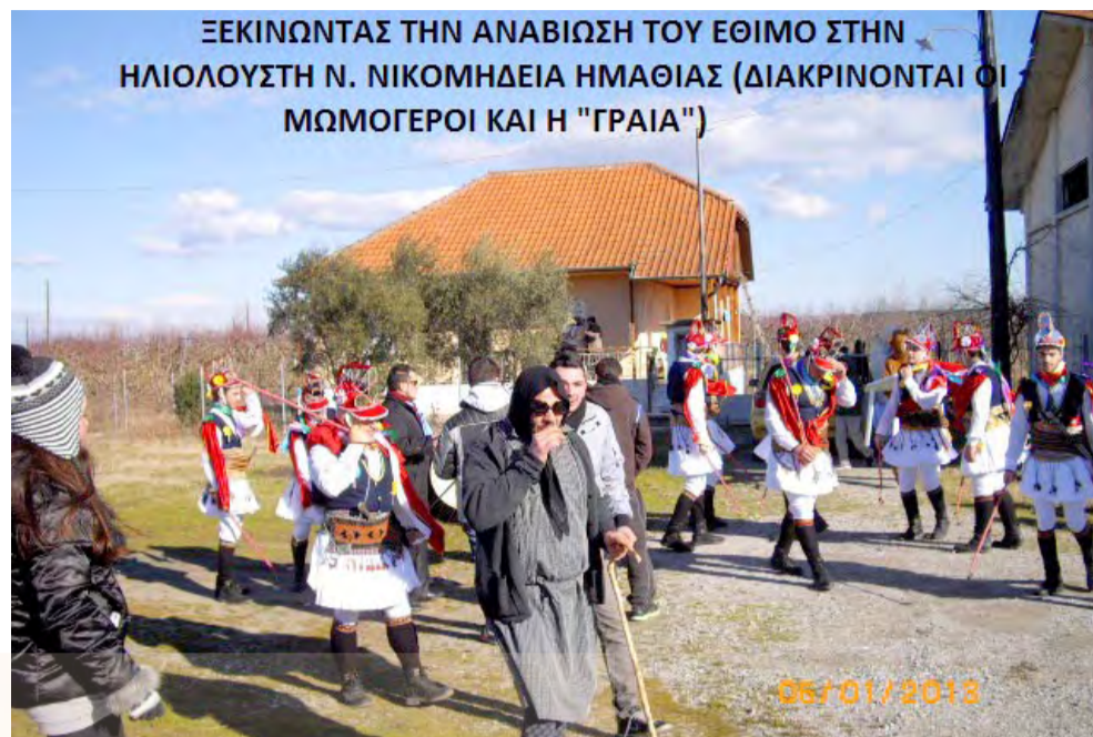
ΞΕΚΙΝΩΝΤΑΣ ΤΗΝ ΑΝΑΒΙΩΣΗ ΤΟΥ ΕΘΙΜΟΥ ΣΤΗΝ ΗΛΙΟΛΟΥΣΤΗ Ν. ΝΙΚΟΜΗΔΕΙΑ ΗΜΑΘΙΑΣ (ΔΙΑΚΡΙΝΟΝΤΑΙ ΟΙ ΜΩΜΟΓΕΡΟΙ ΚΑΙ Η "ΓΡΑΙΑ")