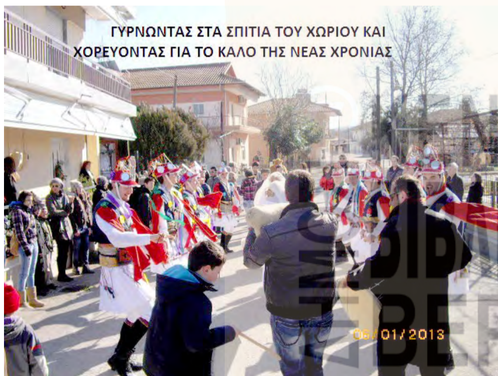
ΓΥΡΝΩΝΤΑΣ ΣΤΑ ΣΠΙΤΙΑ ΤΟΥ ΧΩΡΙΟΥ ΚΑΙ ΧΟΡΕΥΟΝΤΑΣ ΓΙΑ ΤΟ ΚΑΛΟ ΤΗΣ ΝΕΑΣ ΧΡΟΝΙΑΣ