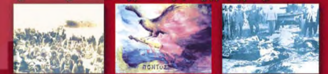
Είναι λοιπόν απαραίτητη η συμμετοχή όλων στις εκδηλώσεις μνήμης για να διεκδικήσουμε δυναμικά τη διεθνοποίηση της γενοκτονίας.