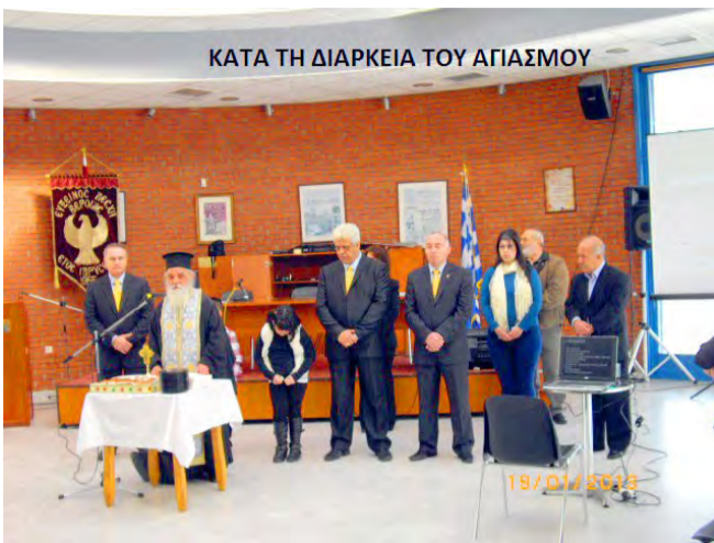
ΚΑΤΑ ΤΗ ΔΙΑΡΚΕΙΑ ΤΟΥ ΑΓΙΑΣΜΟΥ