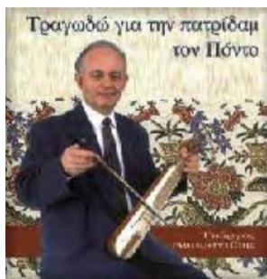
Τραγουδω για την πατρίδα τον Πόντο