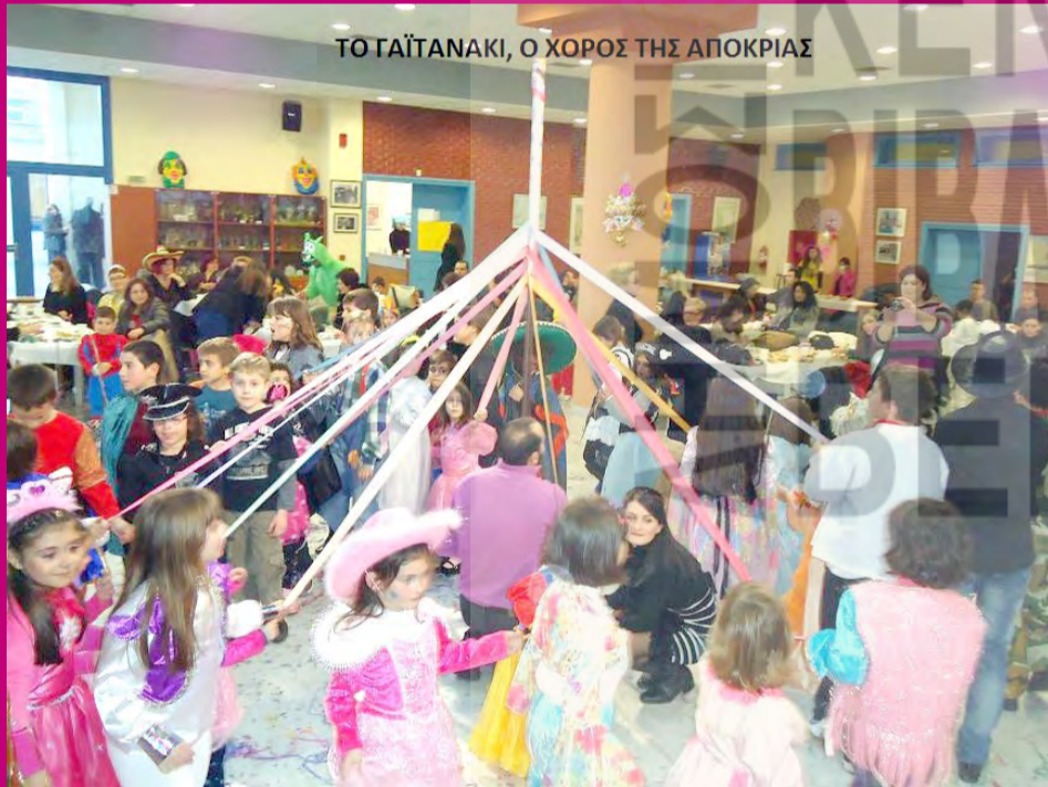
ΤΟ ΓΑΪΤΑΝΑΚΙ, Ο ΧΟΡΟΣ ΤΗΣ ΑΠΟΚΡΙΑΣ