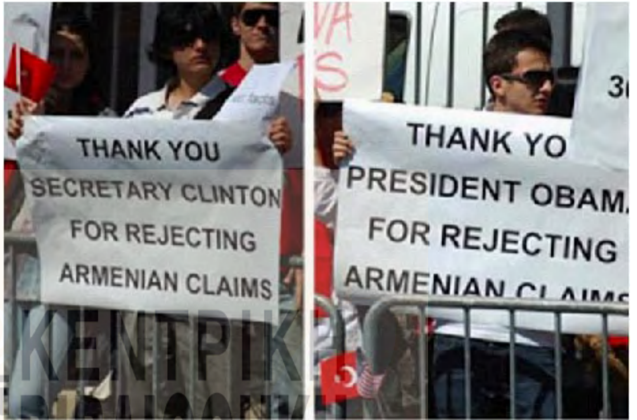
Υπάνθρωποι ευχαριστούν την Κλίντον και τον Ομπάμα που δεν αναγνώρισαν το έγκλημα κατά της ανθρωπότητας...