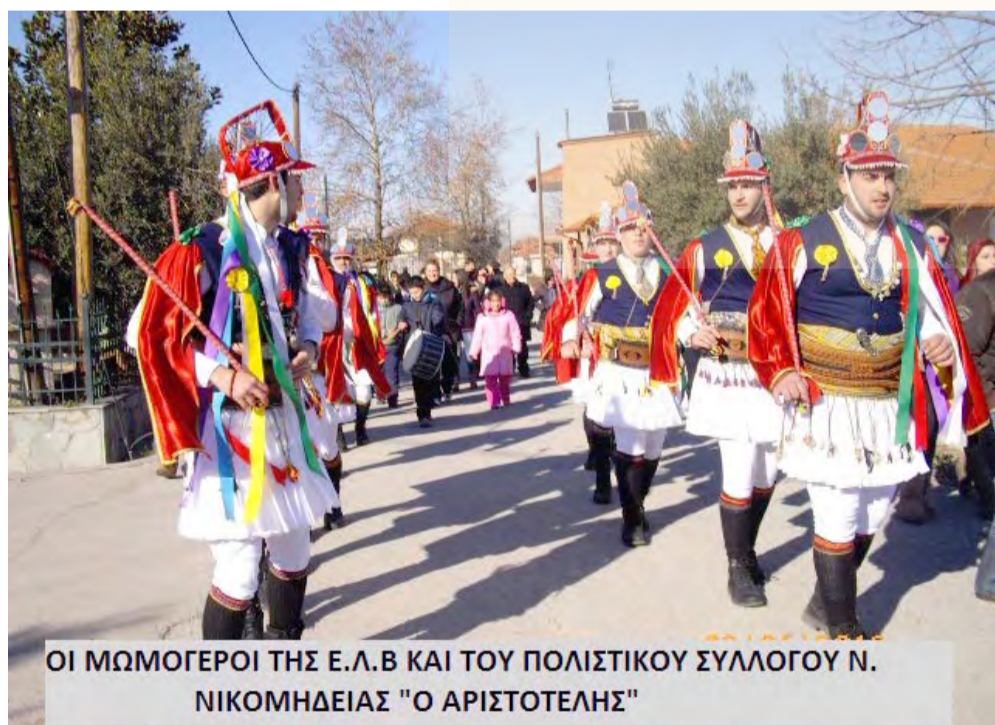
ΟΙ ΜΩΜΟΓΕΡΟΙ ΤΗΣ Ε.Λ.Β ΚΑΙ ΤΟΥ ΠΟΛΙΣΤΙΚΟΥ ΣΥΛΛΟΓΟΥ Ν. ΝΙΚΟΜΗΔΕΙΑΣ "Ο ΑΡΙΣΤΟΤΕΛΗΣ"