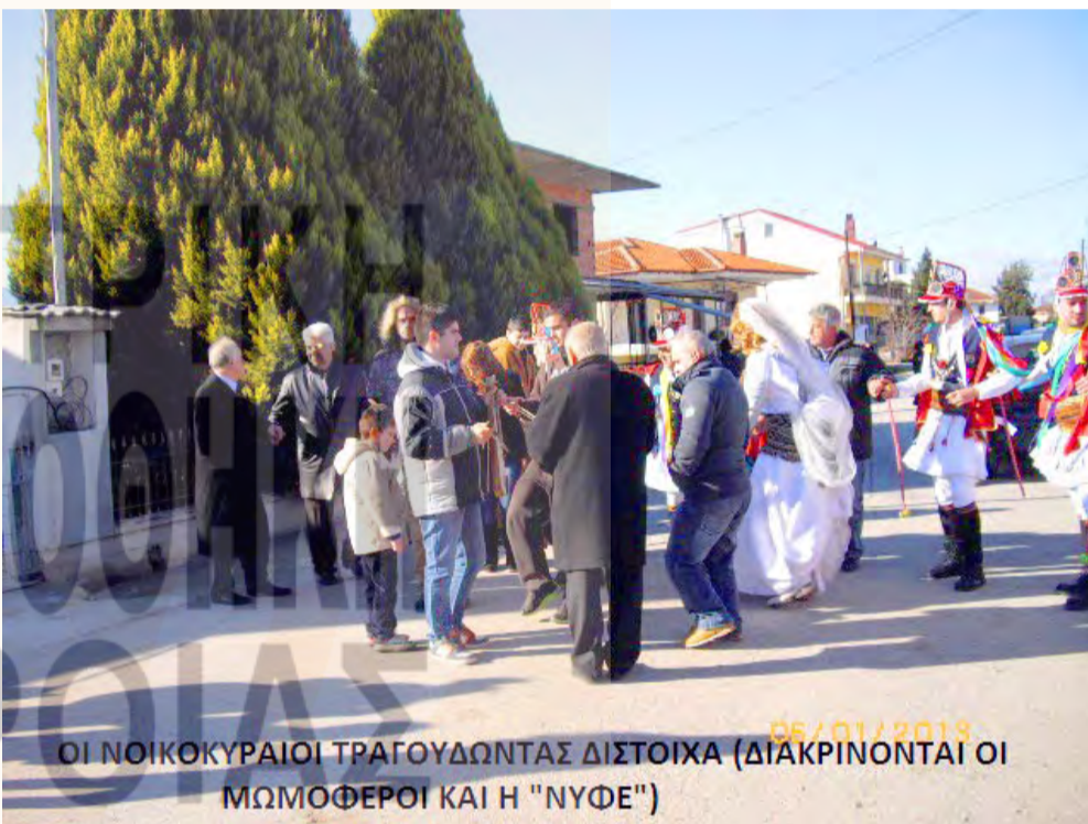
ΟΙ ΝΟΙΚΟΚΥΡΑΙΟΙ ΤΡΑΓΟΥΔΩΝΤΑΣ ΔΙΣΤΟΙΧΑ (ΔΙΑΚΡΙΝΟΝΤΑΙ ΟΙ ΜΩΜΟΦΕΡΟΙ ΚΑΙ Η "ΝΥΦΕ")