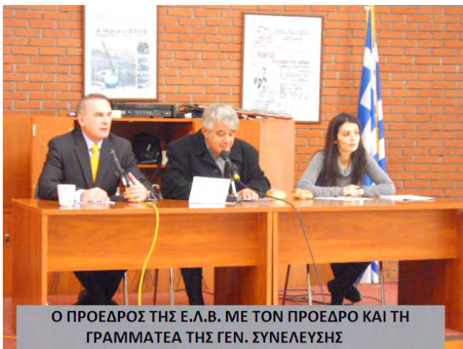
Ο ΠΡΟΕΔΡΟΣ ΤΗΣ Ε.Λ.Β. ΜΕ ΤΟΝ ΠΡΟΕΔΡΟ ΚΑΙ ΤΗ ΓΡΑΜΜΑΤΕΑ ΤΗΣ ΓΕΝ. ΣΥΝΕΛΕΥΣΗΣ