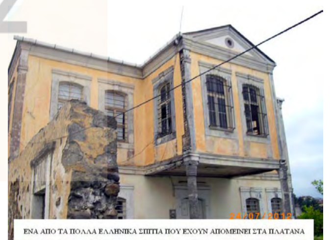
ΕΝΑ ΑΠΟ ΤΑ ΠΟΛΛΑ ΕΛΛΗΝΙΚΑ ΣΠΙΤΙΑ ΠΟΥ ΕΧΟΥΝ ΑΠΟΜΕΙΝΕΙ ΣΤΑ ΠΛΑΤΑΝΑ

Λίγο πριν τις 12:00 και αφού πραγματοποιήθηκε η επιθυμία των τριών φίλων από την παρέα μας, οι οποίοι επισκέφθηκαν τα ιδιαίτερα χωριά της καταγωγής τους το Αρμούτσαϊρ και το Κιοβτεπέ δύο από το σύμπλεγμα