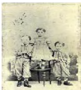
Στην Αλεξάνδρεια σε ηλικία 2 ετών

Ο Κωνσταντίνος Καβάφης ανήκει στους λίγους εκείνους, που πέθαναν τη μέρα των γενεθλίων τους, όπως ο Μανώλης Χιώτης, ο Χρήστος Τσαγανέας, η Ιγκριντ Μπέργκμαν... Γεννήθηκε και πέθανε στις 29 Απριλίου (1863-1933). Θα πίστευε κανείς πως η μοίρα του φανέρωνε τον κύκλο του επίγειου βίου του, που το μαρτυρεί καταφανώς, με μία... αυθαίρετη ερμηνεία, ο στίχος του στο ποίημα «Έμπορος Αλεξανδρέυς»: «...έφθασ' Απρίλιον: φεύγω Απρίλιον. Δεν έχασα καιρόν!»