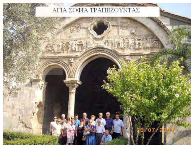
ΑΓΙΑ ΣΟΦΙΑ ΤΡΑΠΕΖΟΥΝΤΑΣ