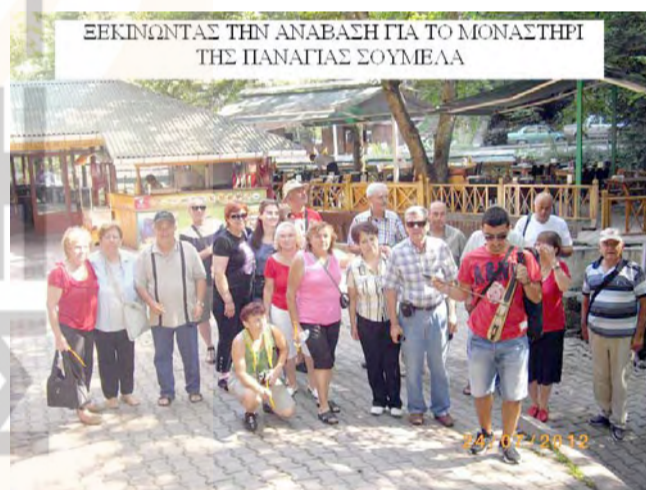
ΞΕΚΙΝΩΝΤΑΣ ΤΗΝ ΑΝΑΒΑΣΗ ΓΙΑ ΤΟ ΜΟΝΑΣΤΗΡΙ ΤΗΣ ΠΑΝΑΓΙΑΣ ΣΟΥΜΕΛΑ

Το απόγευμα επιστρέφουμε στην πόλη των Μεγάλων Κομνηνών, περνώντας πρώτα από τα Λιβερά, που η παράδοση και η ιστορία συνδέουν με την Γκιούλ Μπαχάρ σύζυγο του Σουλτάνου.