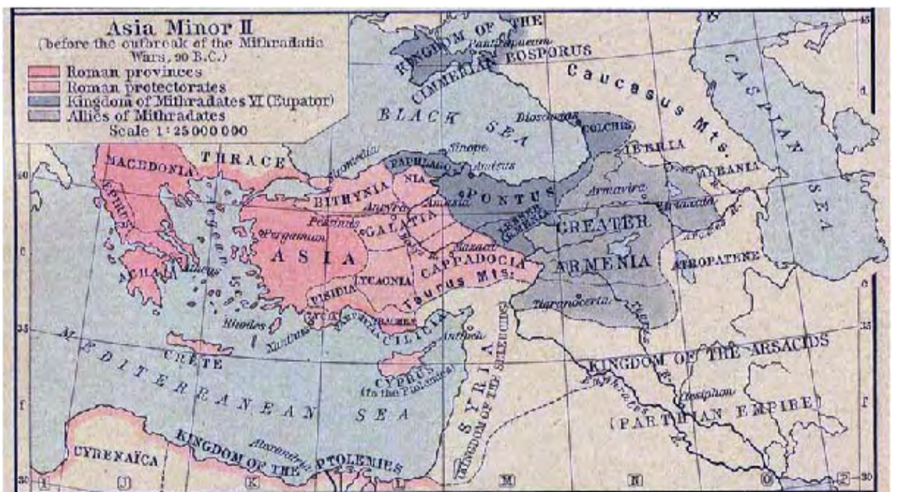
Η Μικρά Ασία, λίγο πριν το ξέσπασμα του Α΄ Μιθριδατικού Πολέμου, το 90 π.Χ

* Ο Γιώργος Κλοκίδης είναι μέλος του Δ.Σ. (ταμίας) της Ε.Λ.Β. Το κείμενο αποτελεί απόσπασμα από μεταπτυχιακή του εργασία. με θέμα: «Μιθριδάτης ΣΤ΄ Ο Ευπάτωρ».