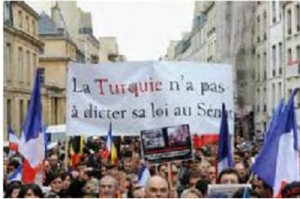
Συνταγματικό Συμβούλιο θα το κανονίσει».

Αυτή η προσφυγή δεν αποτελεί έκπληξη γιατί την περιμέναμε, ωστόσο, το σύνολο των Γάλλων που ενεπλάκησαν σε αυτόν τον αγώνα, για τα ανθρώπινα δικαιώματα πίστευε και ήλπιζε μέχρι το τέλος ότι οι βουλευτές μας δεν θα ενέδιδαν στην τεράστια επιχείρηση πίεσης που εφάρμοσε ένα ξένο αρνητιστικό και ρατσιστικό κράτος. Η ενορχήστρωση αυτής της προσφυγής από τον πραγματικό μέντορα του απεικονίζεται τέλεια με τα λόγια του Πρωθυπουργού Ερντογάν, ο οποίος ανακοίνωσε -ενώ η προσφυγή μόλις επισημοποιήθηκε- τον επόμενο στόχο του: τους «Σοφούς» του Συνταγματικού Συμβουλίου. Δήλωσε: «Ελπίζω ότι το