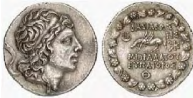
Τετράδραχμο του Μιθριδάτη ΣΤ', 90-89 π.Χ. Στην εμπρόσθια όψη απεικονίζεται η κεφαλή του Μιθριδάτη και στην οπίσθια όψη ο Πήγασος. Η ομοιότητα των χαρακτηριστικών της κεφαλής του Μιθριδάτη με αυτή του Μεγάλου Αλεξάνδρου στα νομίσματα της Μακεδονικής δυναστείας είναι εμφανής.

Στην απόφαση του να δεχθεί την πρόταση των Ελληνικών πόλεων της Κριμαίας καθοριστικό ρόλο έπαιξε ο Διόφαντος, ο