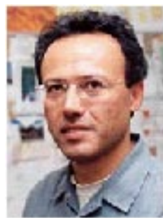
Του Ahmet Oral *

Το Οθωμανικό κράτος που απλωνόταν σε τρεις ηπείρους κατά τον 18ο και 19ο αιώνα, υποχωρώντας στις περιοχές Θράκης, Μικράς Ασίας, Μεσοποταμίας, Καυκάσου και Μέσης Ανατολής προσπάθησε να διαμορφώσει την έννοια της Οθωμανικής Κοινοπολιτείας ώστε να σταματήσει η περαιτέρω συρρίκνωση.