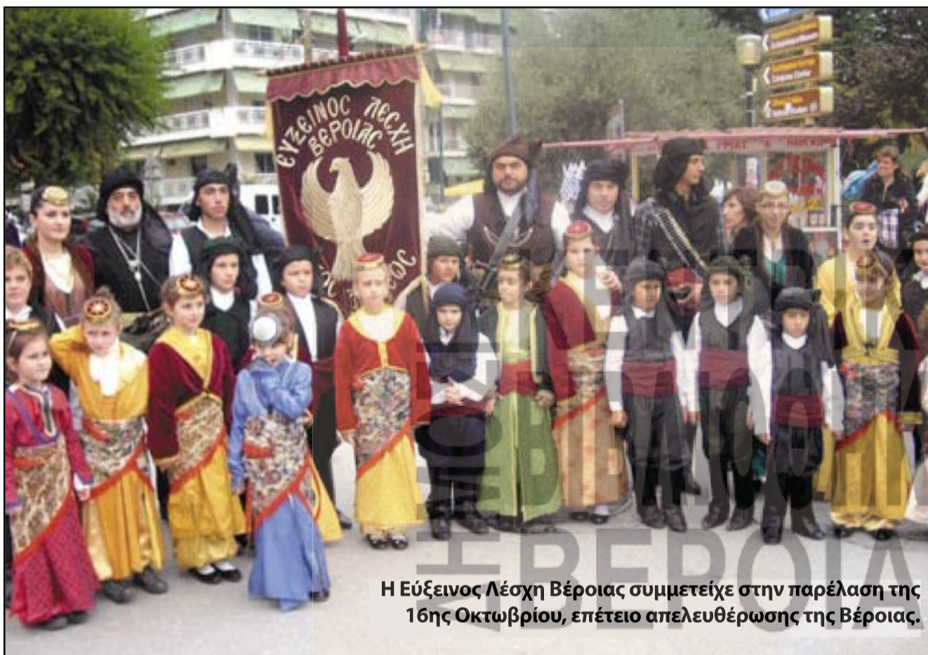
Η Ευξείνος Λέσχη Βέροιας συμμετείχε στην παρέλαση της 16ης Οκτωβρίου, επέτειο απελευθέρωσης της Βέροιας.

Ο Τριαντάφυλλος Ηλιάδης είναι μέλος της Διεθνούς Ένωσης Αναπήρων Καλλιτεχνών (VDMFK) που εδρεύει στο Λιχτενστάιν. Ζωγραφίζει πρωτίστως για τη VDMFK θέματα χριστουγεννιάτικα-εορταστικά και έπειτα έργα που απεικονίζουν την παλιά Ξάνθη και τα επαγγέλματα που έχουν χαθεί ή που τείνουν να εξαλειφθούν. Σήμερα ζει μόνιμα στη Θέρμη Θεσσαλονίκης, όπου έχει μόνιμη έκθεση ζωγραφικής, είναι παντρεμένος επί τριάντα τρία χρόνια και έχει αποκτήσει δύο κόρες.