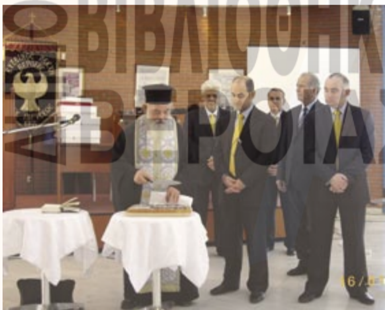
Κοπή της βασιλόπιτας