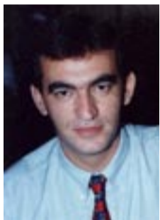
Επιμέλεια: Χωραφαϊδης Αβραάμ

Το 1826-28 μετά το Ρωσοτουρκικό πόλεμο οι κάτοικοι της κωμόπολης Κονόριζα της περιοχής της Αργυρούπολης (Κιουμουσχανέ) του Πόντου, όλοι μεταλλωρύχοι, με σουλτανικό διάταγμα του Μαχμούτ του Β' μετανάστευσαν στη μεταλλοφόρα περιοχή του Ταύρου, όπου ίδρυσαν την κωμόπολη «Μεταλλείον Ταύρου» με 4.500 κατοίκους (Μπουγά Μαδενί). (Εγκυκλοπ. ΗΛΙΟΣ, σελ 375)