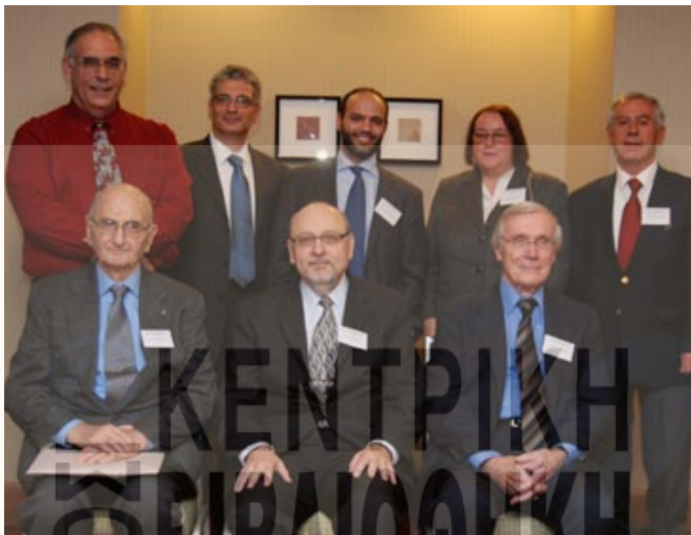
3η Ακαδημαϊκή Σύνοδος στο Σικάγο, 6 Νοεμβρίου 2010.

Την εκδήλωση παρακολούθησαν αρκετοί σημαντικοί φορείς του ελληνικού στοιχείου της περιοχής του Σικάγο, όπως και σημαντικές προσωπικότητες από τις ανατολικές Πολιτείες των ΗΠΑ. Παράλληλα το κοινό έδειξε μεγάλο ενδιαφέρον, ξεπερνώντας, με ερωτήσεις και παρατηρήσεις, το διαθέσιμο χρόνο, επιζητώντας ευρεία