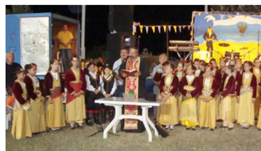
Από τον Αγιασμό που πραγματοποιήθηκε κατά την πρώτη ημέρα.