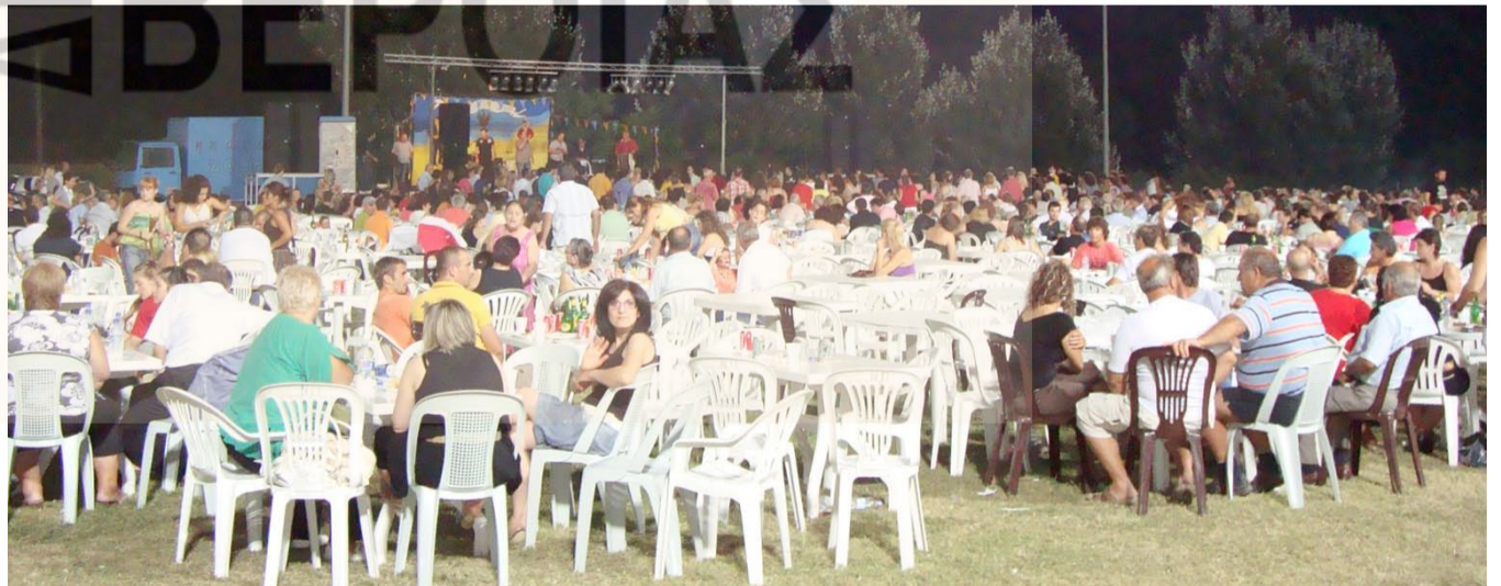
Η συμμετοχή του κόσμου από την Ημαθία, αλλά και από την ευρύτερη περιοχή ήταν εντυπωσιακή.