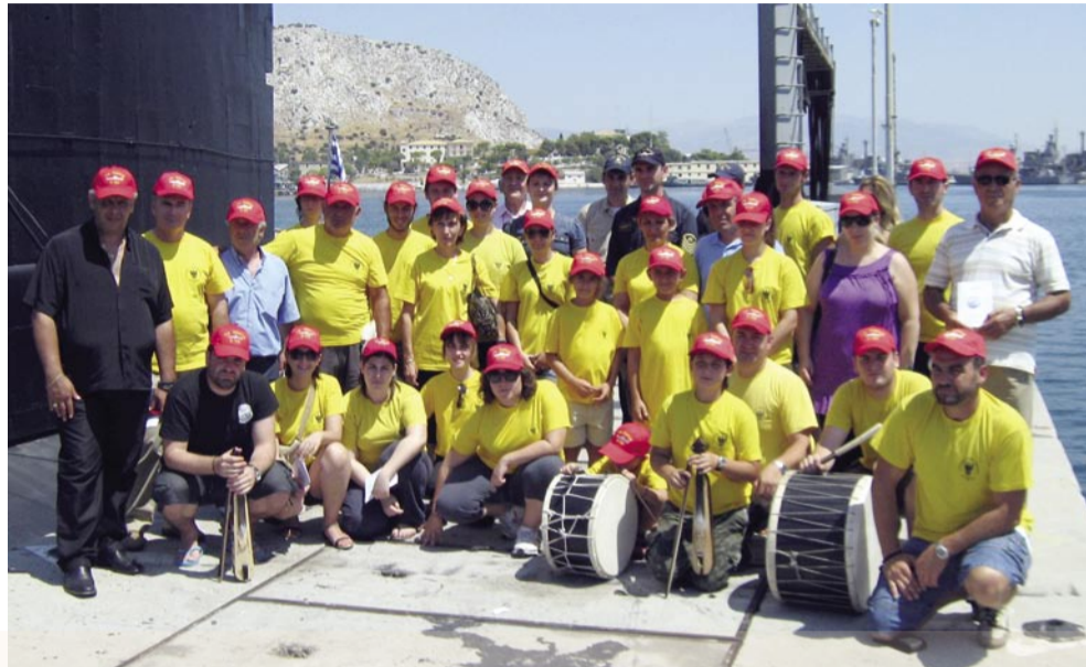
Στο υποβρύχιο «Πόντος», ΕΥΞΕΙΝΟΣ ΛΕΣΧΗ ΒΕΡΟΙΑΣ Αύγουστος 2009

«Γέρν και καλοτάξιδον του Πόντου εσύ δελφίνι Ο Αη Νικόλας μετ' εσέν για να κρατείς ειρήνη»