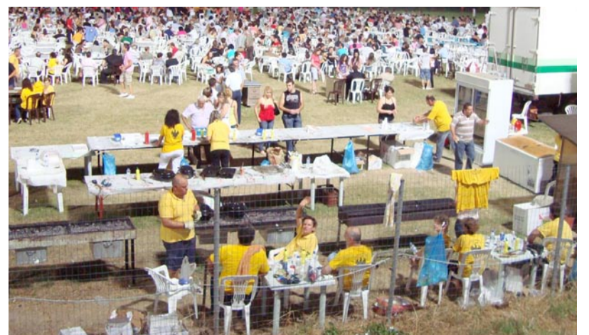
Για ακόμη μια χρονιά οι εθελοντές έδωσαν και την ψυχή τους για την επιτυχία των εκδηλώσεων!