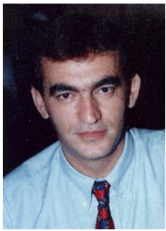
Επιμέλεια: Χωραφαϊδης Αβραάμ

Η πόλη είναι κτισμένη στα παράλια του Εύξεινου Πόντου, στις υπώρειες του όρους Μπόζτεπε και δίπλα από τον ποταμό Μελάνθιο, που ρέει ανατολικά της πόλης. Τα Κοτύωρα μνημονεύει ο Ξενοφών στο έργο του «Κύρου Ανάβασις», αναφέροντάς τα ως «πόλιν Ἑλληνίδα Σινωπέων αποικίαν». Ο ίδιος αναφέρει, επίσης, ότι οι Κοτυωρίτες πλήρωναν φόρο υποτέλειας στους Σινωπείς, οι οποίοι έστελναν στην πόλη αρμοστή για να την ελέγχουν και να την προστατεύουν. Εδώ παρέμειναν επί 45 ημέρες οι Μύριοι του Ξενοφώντα, πριν αποπλεύσουν για τη Σινώπη και αργότερα για την Ελλάδα.