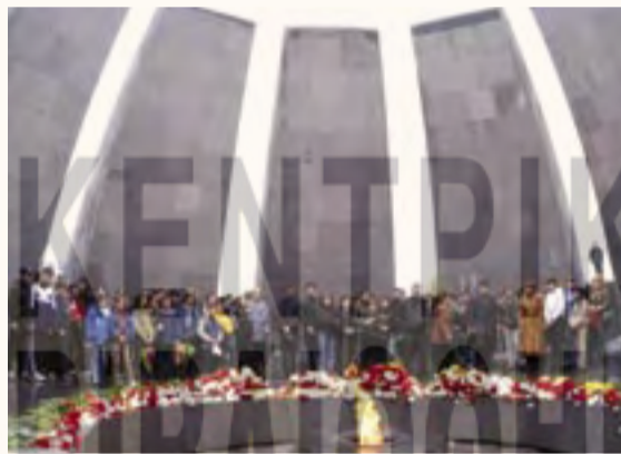
Το μνημείο της Αρμενικής Γενοκτονίας στο Ερεβάν