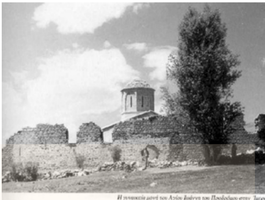
Η γυναικεία μονή του Αγίου Ιωάννη του Προδρόμου στην Ίμερα

Στον οικισμό Σαράντων υπήρχε η εκκλησία του Αγίου Θεοδώρου του στρατηλάτη, τη Κρωμ' ο Αεθόδωρον, που πανηγύριζε στις 8 Ιουνίου.