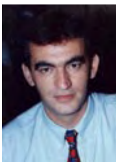
Επιμέλεια: Χωραφαϊδής Αβραάμ

Κωμόπολη της επαρχίας Χαλδίας στο νομό Τραπεζούντας. Βρίσκεται στο όρος Παρύαρη, ανατολικά των Ποντικών ορέων, σε απόσταση 16 ωρών (με τα πόδια) στα νότια της Τραπεζούντας και 5 ωρών ΒΑ της Αργυρούπολης. Το