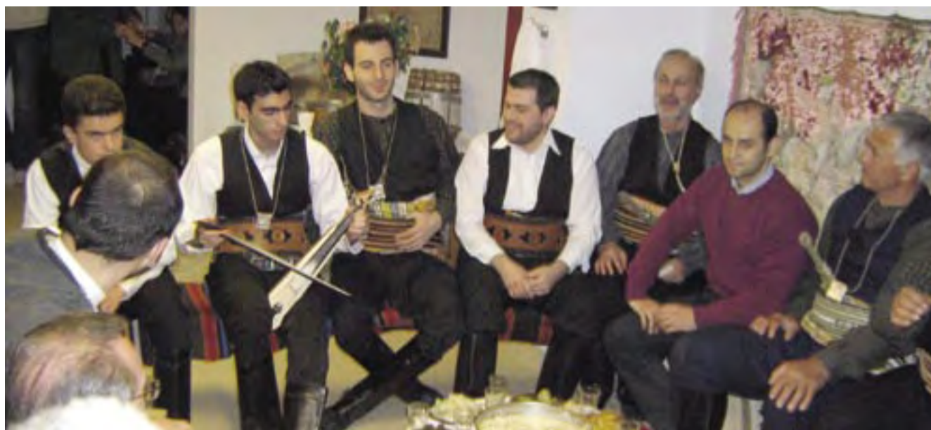
Από τα γυρίσματα της εκπομπής «Κάθε τόπος και το τραγούδι του» της ΕΤ3