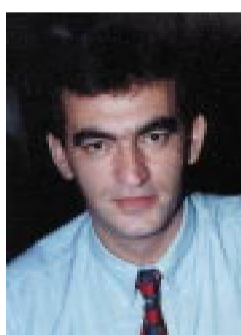
Επιμέλεια: Χωραφαΐδης Αβραάμ

Η Κασταμονή ή Κασταμών ή Κασταμόνα και τουρκικά Καστάμονου είναι ιστορική πόλη του βορειοδυτικού Πόντου γενέτειρα βυζαντινών Αυτοκρατόρων. Γη αρχαιοελληνικών αποικιών. Αυτή η μάνα βυζαντινών αυτοκρατόρων, αυτή η σχεδόν ξεχασμένη γωνιά του Δυτικού Πόντου έπαιξε στο παρελθόν σημαντικό ρόλο στις υποθέσεις της βυζαντινής αυτοκρατορίας. Βρίσκεται στη περιοχή της αρχαίας Παφλαγονίας επί της πλαγιάς όρους σε υψόμετρο 900 περίπου μέτρα.