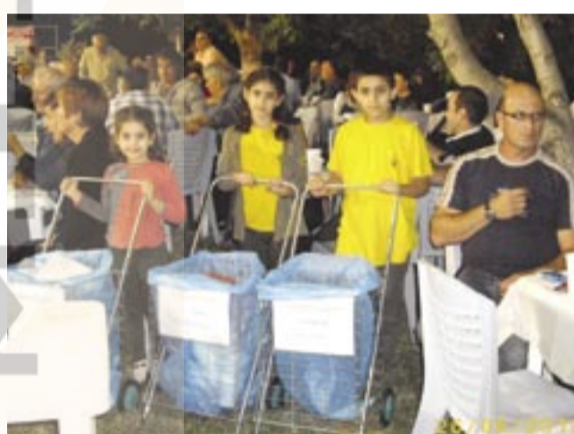
Οι μικροί εθελοντές της Ε.Λ.Β. προωθούν την ιδέα της ανακύκλωσης.