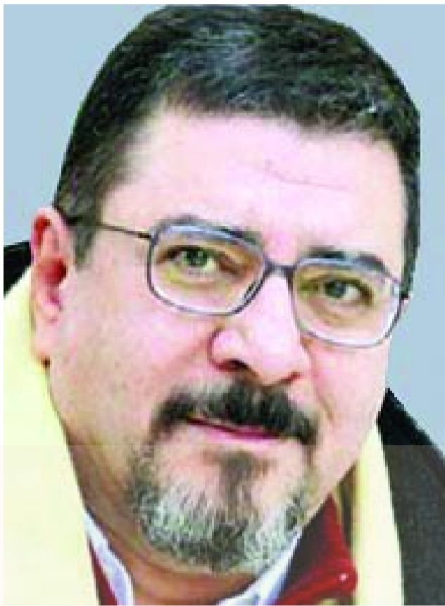
θα καλούσαμε πίσω τον πρέσβη μας από την Ελλάδα.

Δεν θα μας άρεσε, θα ξεσηκώναμε τον κόσμο, μέχρι που