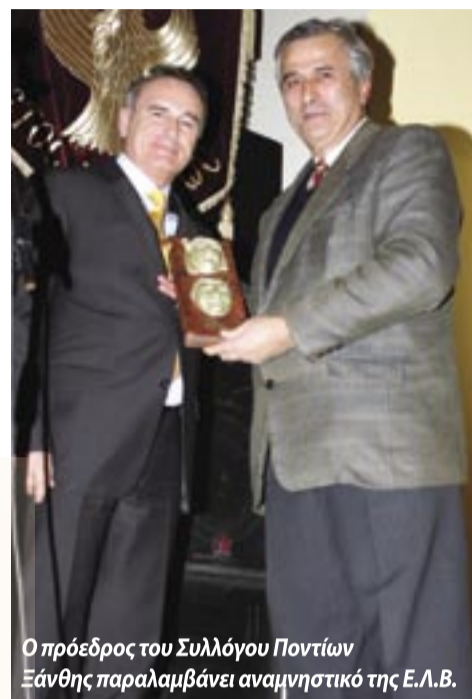
Ο πρόεδρος του Συλλόγου Ποντίων Ξάνθης παραλαμβάνει αναμνηστικό της Ε.Λ.Β.

Όμως πρέπει να τονίσω, όπως έκανα από βήματος, ότι την όλη παρουσία μας την αφιερώσαμε στην μνήμη του μεγάλου αγω-