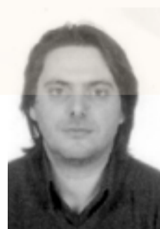
Γράφει ο Γιώργος Κασαμπαλίδης

Η λαογραφία στη χώρα μας γεννήθηκε από την ανάγκη να υποδείξει το ελληνικό κράτος τη συνέχεια με την αρχαία Ελλάδα, καθώς και να αντικρούσει τις θεωρίες του Φαλμεράιερ, θεωρίες που σαφέστατα δεν αγγίζουν εμάς τους Πόντιους. Συμπληρώθηκαν 100 χρόνια από την ίδρυση της Ελληνικής λαογραφικής εταιρίας.