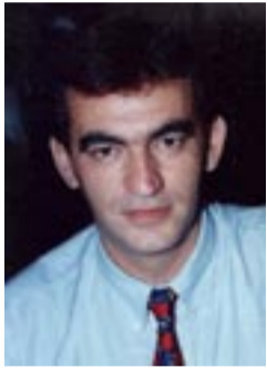
Επιμέλεια: Χωραφαΐδης Αβραάμ

Η πόλη υπήρχε από την κλασική εποχή, από την οποία χρονολογείται το κάστρο της, που είναι χτισμένο σε λόφο που υψώνεται στα ΝΑ της πόλης και διασώζεται μέχρι σήμερα. Την ονομασία Νικόπολη η πόλη έλαβε από τον Πομπήιο, σε ανάμνηση της νίκης του το 66 π.Χ. κατά του Μιθρηδάτη του Ευπάτορα, γεγονός που αναφέρει και ο Στράβωνας.