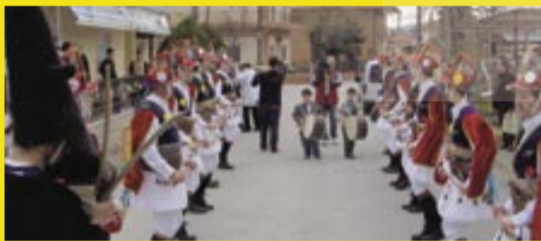
Οι εκδηλώσεις προσέλκυσαν το ενδιαφέρον πολύ κόσμου και καλύφθηκαν τηλεοπτικά από την ΕΡΤ.