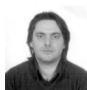
Γράφει ο Γιώργος Κασαμπαλίδης

Τα "Μωμο'ερια", οι ιερείς του θεού Μώμου, έχουν τις ρίζες τους στα τελετουργικά δρώμενα των πρώτων κοινωνιών των ανθρώπων με απώτερο σκοπό την γονιμότητα. Στο πέρασμα του χρόνου, αυτή η μορφή θεάτρου δέχονταν επιδράσεις και νέα στοιχεία. Νομίζω πως είναι ευδιάκριτο το γεγονός ότι η Διονυσιακή λατρεία είναι μεταγενέστερη των μυστηριακών αυτών δρώμενων. Με την άποψη αυτή,