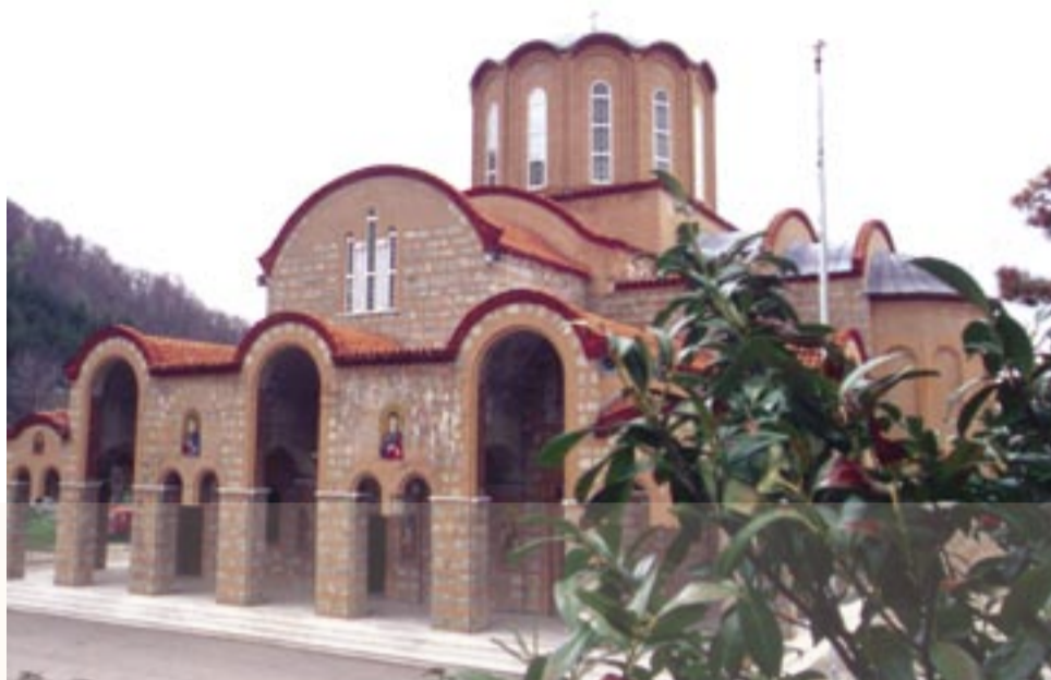
Ιερά Μονή, εναντίον όλων, όσους θεωρούν αντιπάλους τους.

Με την αδράνεια αυτή των υπευθύνων, ζήσαμε και την αμαύρωση των θρησκευτικών τελετών, με όσα συνέβησαν (τον περασμένο 15αύγουστο) εκεί στις πλαγιές του Βερμίου. Με φουσκωτούς και άτομα σεκιούριτι, αντιμετώπισαν οι κατέχοντες την