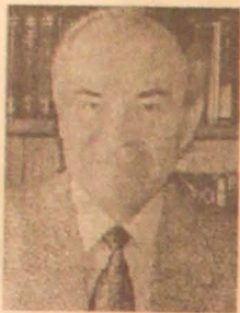
Του Αχ. Λαζάρου, Ρωμανιστή-Βαλκανολόγου

Το πρώτο συνθετικό της επικεφαλίδας ανάγει στην Αρβανιτία των Δημητρίων Δανιήλ Φιλίππιδη και Γρηγορίου Κωνσταντά, οι οποίοι στη